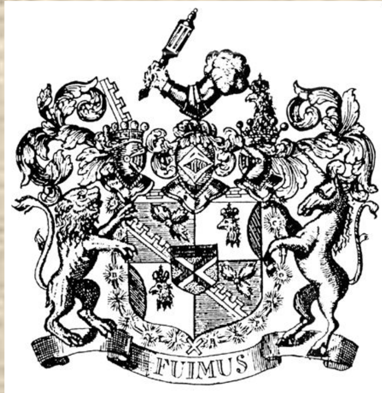
Экслибрис Я.В. Брюса

Начало этому положили сподвижники Петра I Д.М. Голицын, Я.В. Брюс и другие.