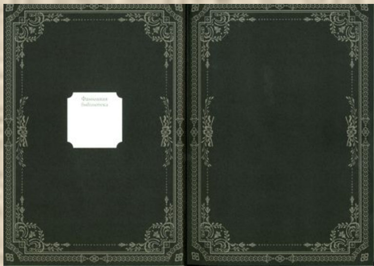
Форзац с местом для экслибриса

Обычно экслибрис наклеивался на внутреннюю сторону верхней крышки переплета.