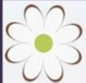
Таблица деления на 7