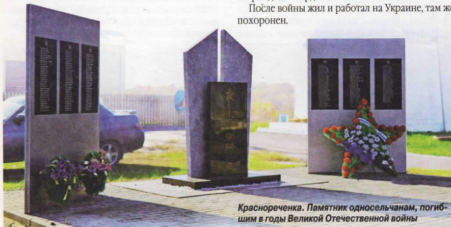
Краснореченка. Памятник односельчанам, погибшим в годы Великой Отечественной войны

После войны жил и работал на Украине, там же похоронен.