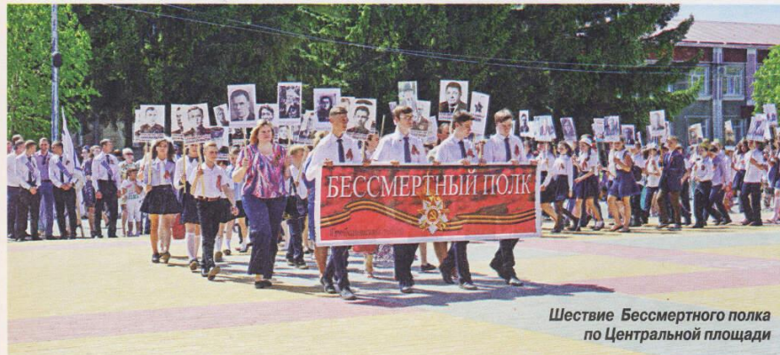
Шествие Бессмертного полка по Центральной площади

После войны Григорьевский окончил академию Генштаба, командовал корпусами в Германии, Закавказском и Дальневосточном военных округах. После выхода в запас вернулся на Кавказ.