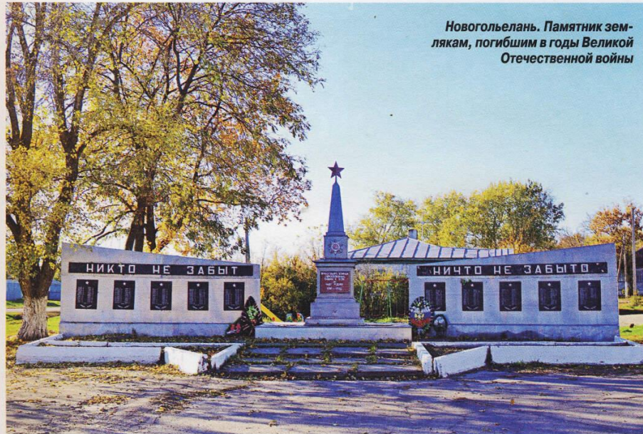
Новогольшельань. Памятник землякам, погибшим в годы Великой Отечественной войны