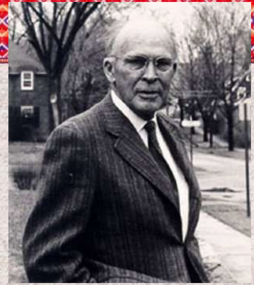
Лесли Уайт – основатель культурологии (1900 – 1975 гг.)

Существующие культурологические школы и направления имеют достаточно размытые границы между собой, нередко используют концептуальные достижения других для обоснования собственных положений.