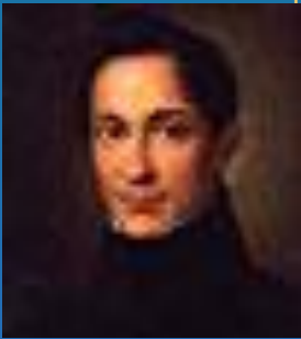
А.И. Герцен 1812-1870

Социализм – учение, выдвигающее в качестве цели и идеала установление общества, в котором отсутствуют эксплуатация человека человеком и социальное угнетение; утверждаются социальное равенство и справедливость