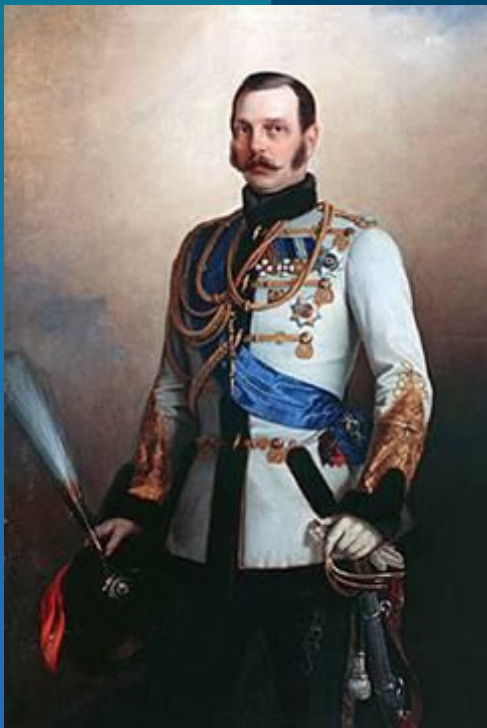
Александр II Освободитель 1818 - 1881 1855 - 1881