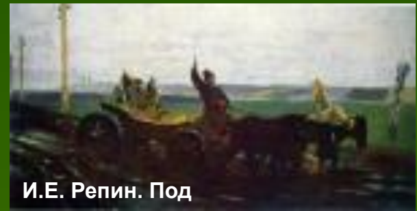
И.Е. Репин. Под