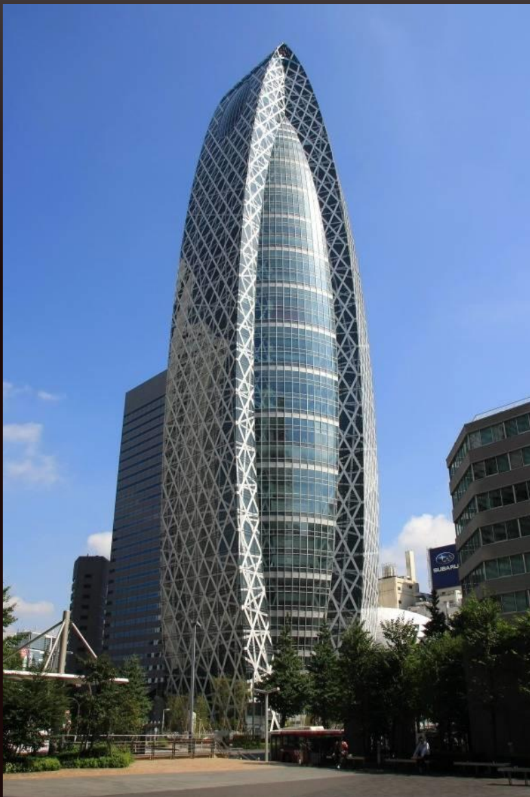
Здание в виде стеклянного кокона расположено в Токио