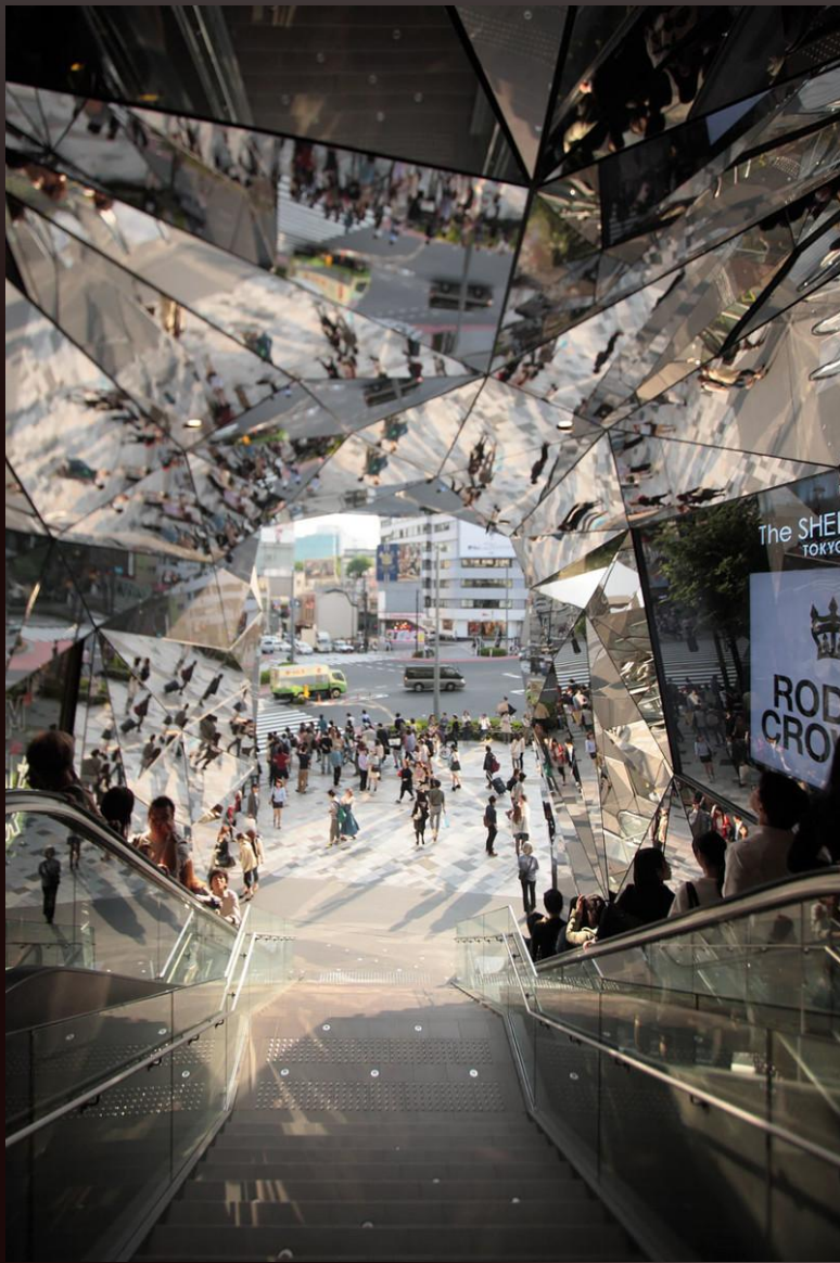
Зеркальная входная группа (шопинг-мол Токио Плаза Омотесандо Хараюку)