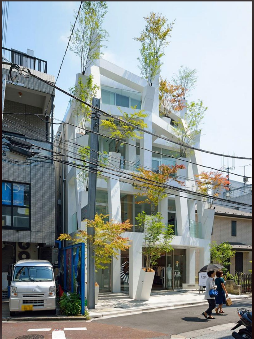
Здание Омотесандо Бранчес, Токио