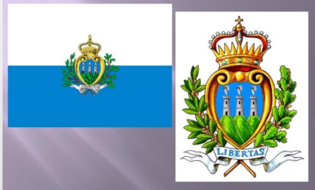
Флаг и герб Сан-Марино

Площадь 61 кв.км Часть территории скальный массив. Выращивают виноград, пшеницу, кукурузу, персики. На скалах растут фисташки, дубы, дроки, мирты.