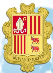
Герб Княжества Андорра

Андорру окружают 65 высоких гор. Зимой для туристов это горнолыжный спорт. В стране сохранились десятки церквей 11-13 вв.