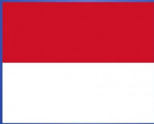
Флаг и герб Монако

ОСНОВАНИЕ ПОСЕЛЕНИЯ СВЯЗЫВАЮТ С ГЕРОЕМ ДРЕВНЕГРЕЧЕСКИХ МИФОВ – ГЕРАКЛОМ. ОСНОВНОЕ НАЗВАНИЕ МОНАКО ОТ СЛОВА «УЕДИНЁННЫЙ». ИЗВЕСТНОСТЬ МОНАКО ПОЛУЧИЛО ВО ВРЕМЯ ПРАВЛЕНИЯ КАРЛА III.