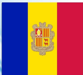
Флаг Княжества Андорра