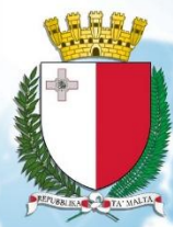
Герб Республики Мальта

Национальное растение страны-палеоцентаурея. Предок василька. Местные жители сохранили традиционные ремесла: чеканку по серебру и золоту, плетение, стеклодувные мастерские., производят лекарства, электронику. Большую часть дохода Мальта получает благодаря туризму.