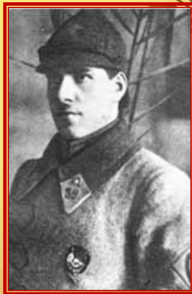
Г.Жуков – в Красной армии

Имя полководца тесно связано с Беларусью - в 1923 году Георгий Жуков впервые прибыл в БССР. В конце сентября 7-я Самарская кавалерийская дивизия, в которой он командовал полком, выступила в район Орши для участия в окружных маневрах, которые проводились впервые после гражданской войны. Затем дивизия прибыла в Минск, к месту постоянного расквартирования части. Здесь с 1926 по 1931 год будущий маршал работал внештатным преподавателем военной кафедры БГУ.