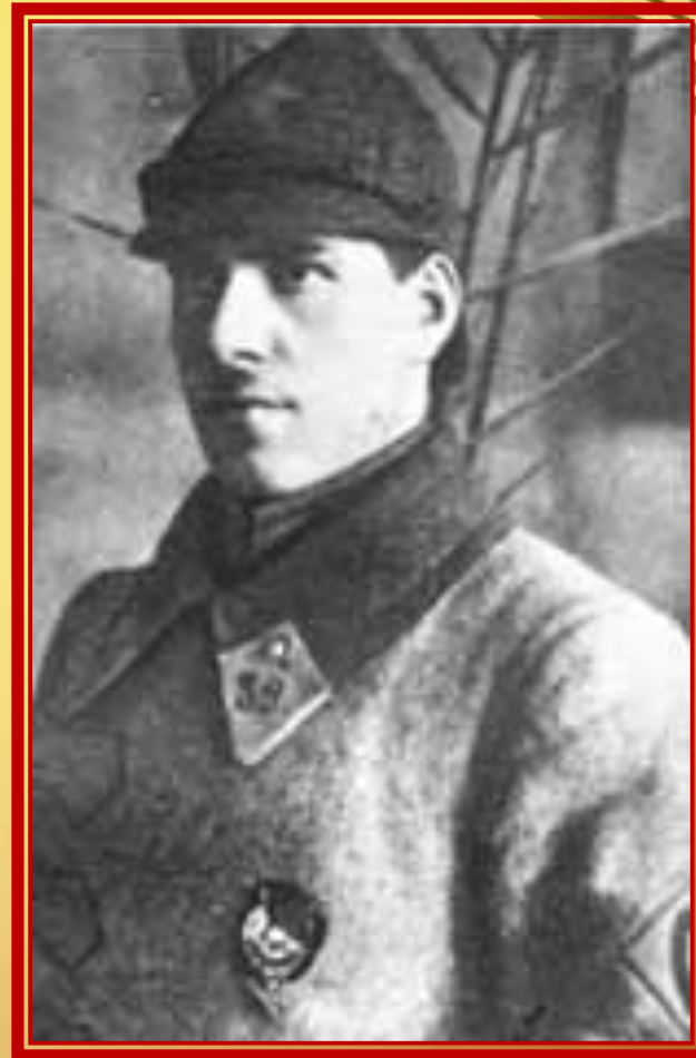
Г.Жуков – в Красной армии

Имя полководца тесно связано с Беларусью - в 1923 году Георгий Жуков впервые прибыл в БССР. В конце сентября 7-я Самарская кавалерийская дивизия, в которой он командовал полком, выступила в район Орши для участия в окружных маневрах, которые проводились впервые после гражданской войны. Затем дивизия прибыла в Минск, к месту постоянного расквартирования части. Здесь с 1926 по 1931 год будущий маршал работал внештатным преподавателем военной кафедры БГУ.