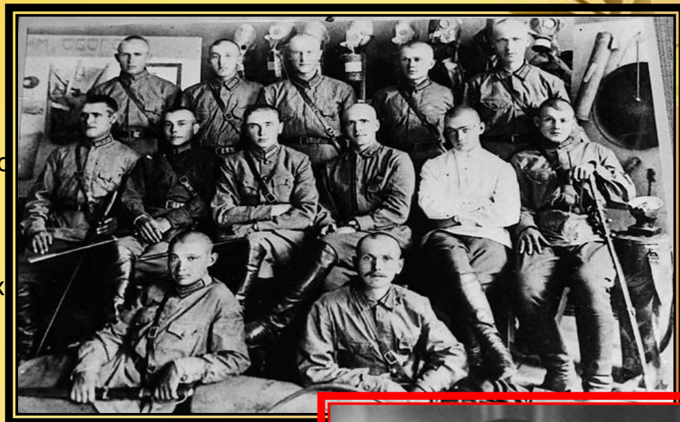
Г.К. Жуков – во втором ряду. Третий слева.

Однако расставание Жукова с Беларусью было недолгим. Он вернулся в республику в 1933 году и служил еще шесть лет. Командовал 4-й кавалерийской дивизией имени Климента Ворошилова, которая базировалась в Слуцке, 3-м кавалерийским корпусом - со штабом в Минске. В июле 1938 года Георгий Жуков стал заместителем командующего войсками Белорусского особого военного округа по кавалерии.