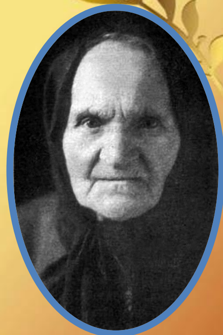
Мать Г.К.Жукова - Устинья Артемьевна Жукова