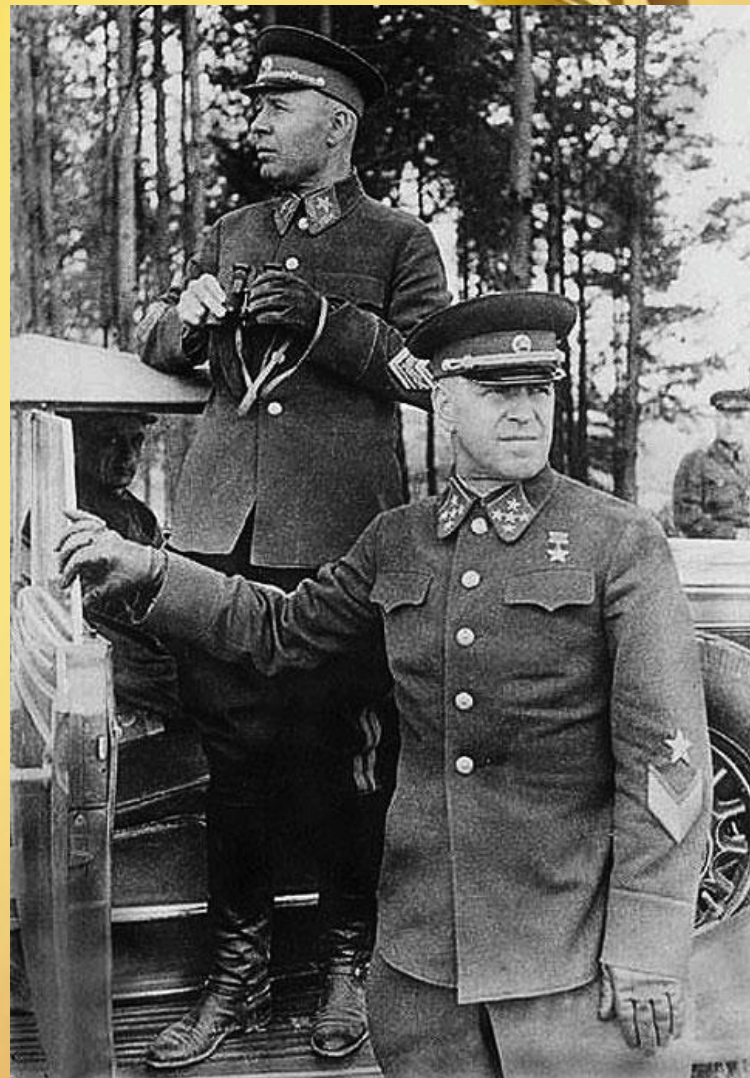
Тимошенко и Жуков на Западном фронте. 1941г.

Он бросил основные силы артиллерии Резервного фронта против танковых и моторизованных дивизий. Увидев, как запылали десятки танков и машин, фельдмаршал приказал отвести бронетанковые силы, заменить их пехотой. Но и это не помогло. Под мощным огневым воздействием фашисты были вынуждены отступить. Опасный выступ был ликвидирован. В боях под Ельней родилась советская гвардия.