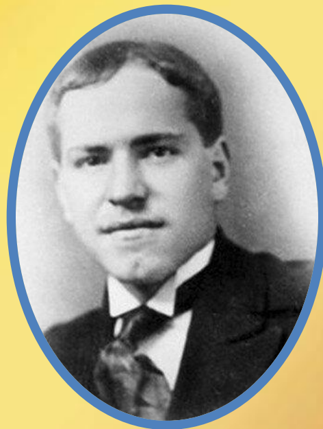
Георгий Жуков в юности