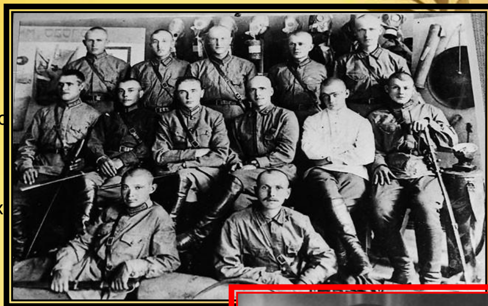
Г.К. Жуков – во втором ряду. Третий слева.

Однако расставание Жукова с Беларусью было недолгим. Он вернулся в республику в 1933 году и служил еще шесть лет. Командовал 4-й кавалерийской дивизией имени Климента Ворошилова, которая базировалась в Слуцке, 3-м кавалерийским корпусом - со штабом в Минске. В июле 1938 года Георгий Жуков стал заместителем командующего войсками Белорусского особого военного округа по кавалерии.