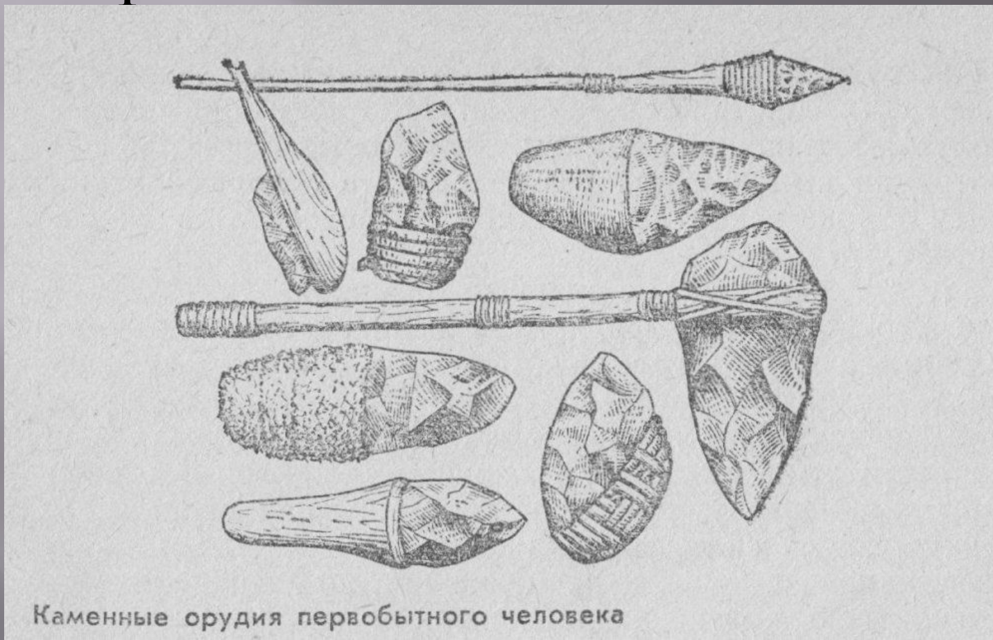
Каменные орудия первобытного человека