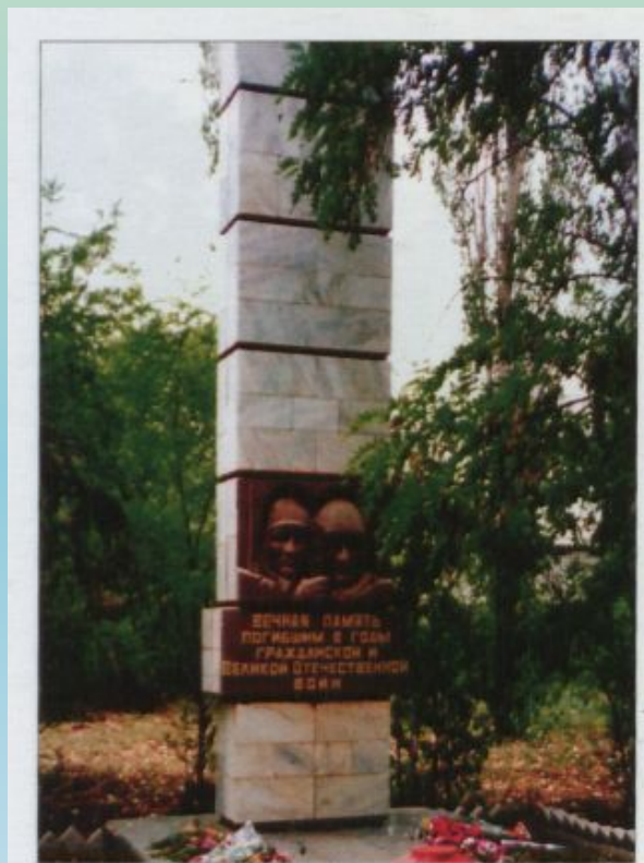
Братская могила советских воинов, погибших в период Сталинградской битвы, р. п. Лог, центр.

В настоящее время на территории села Лог находятся братские могилы советских воинов, погибших в период Сталинградской битвы.