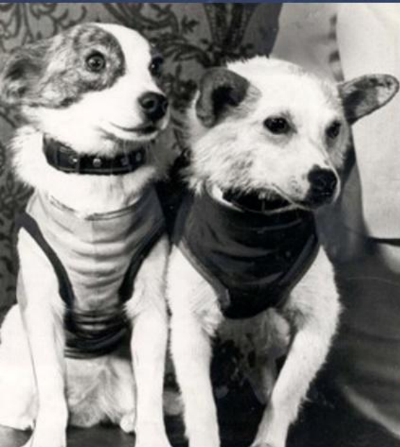
БЕЛКА И СТРЕЛКА