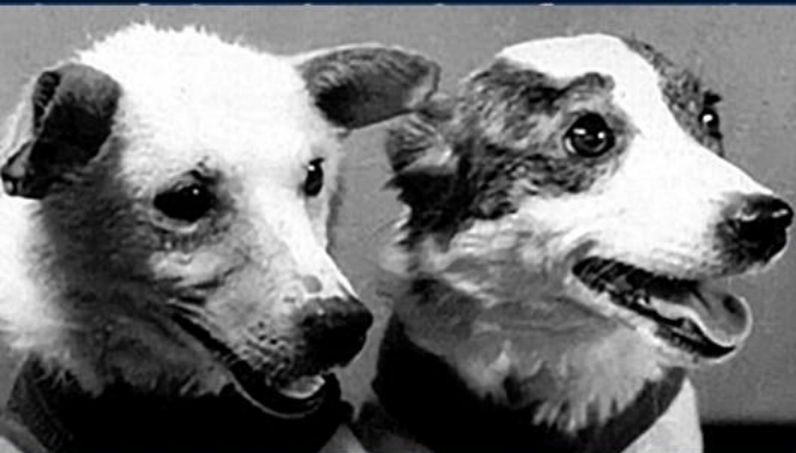
БЕЛКА И СТРЕЛКА