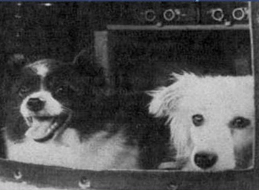
ДЕЗИК И ЦЫГАН