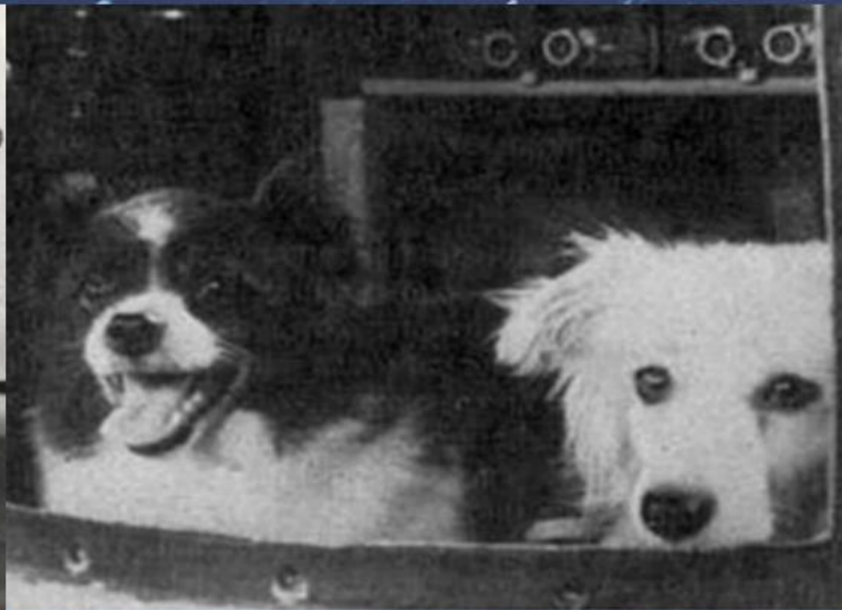
ДЕЗИК И ЦЫГАН