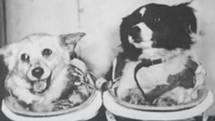
ДЕЗИК И ЦЫГАН