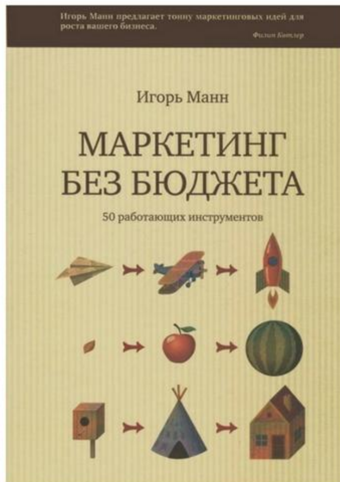
МАРКЕТИНГ БЕЗ БЮДЖЕТА