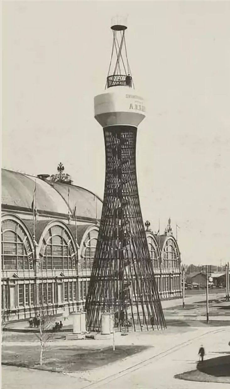
Первая в мире гиперболоидная башня Шухова