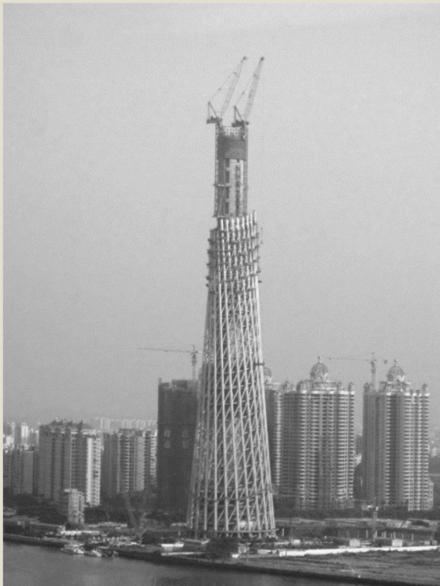
Гиперболоидная шуховская 610-метровая Телебашня в Гуанчжоу