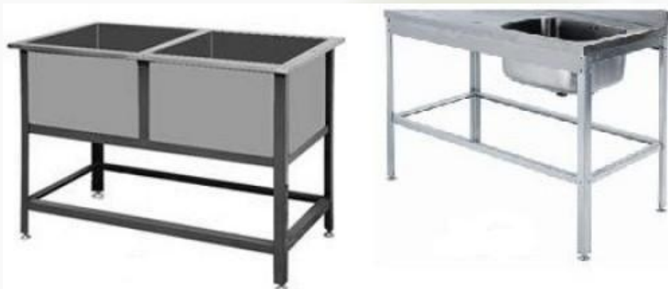
Ванны моечные различного исполнения

Изготовлений изделий по эскизам Заказчика