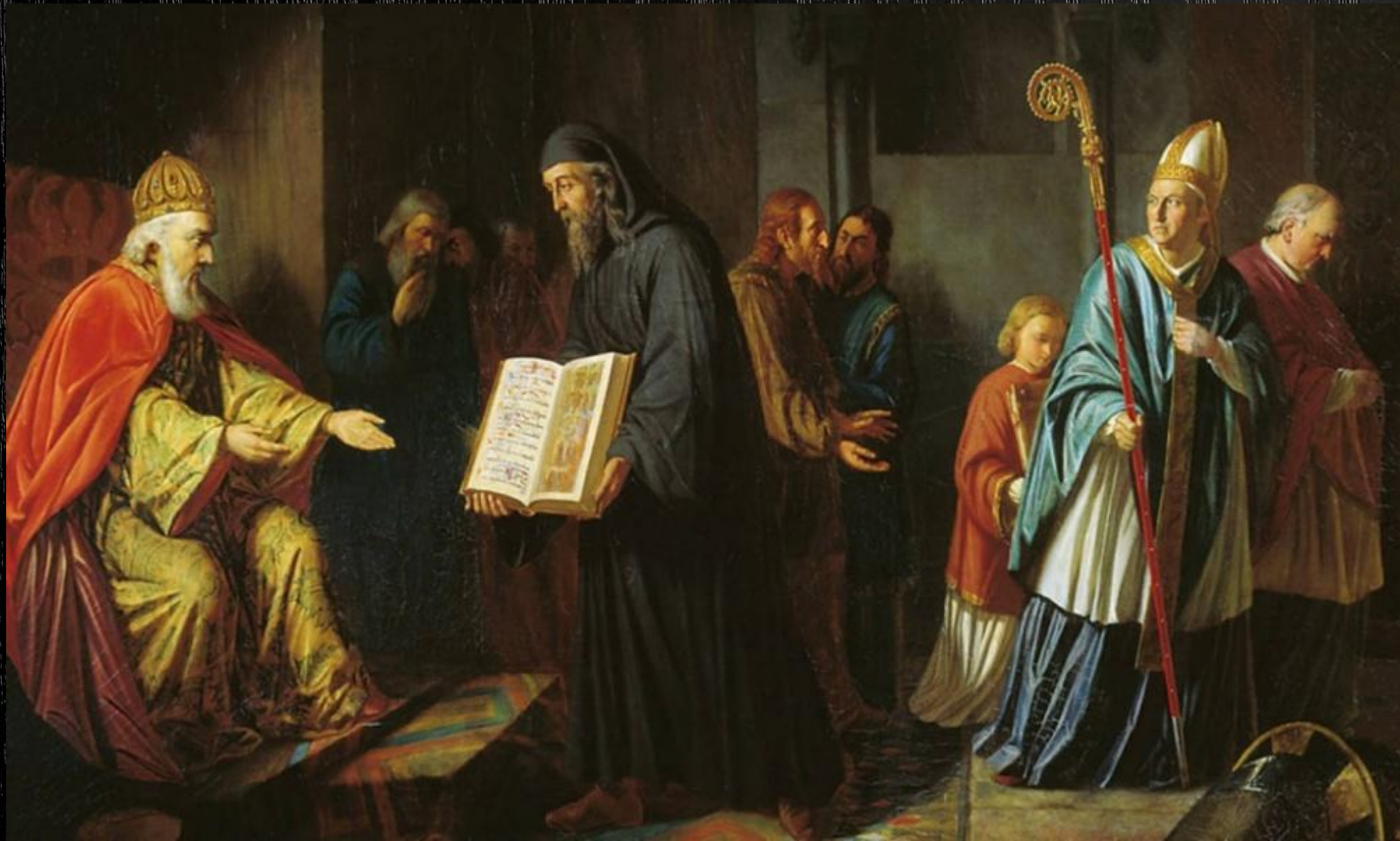
Великий князь Владимир выбирает веру