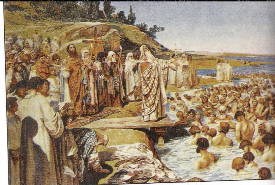
Крещение Руси. К. Лебедев