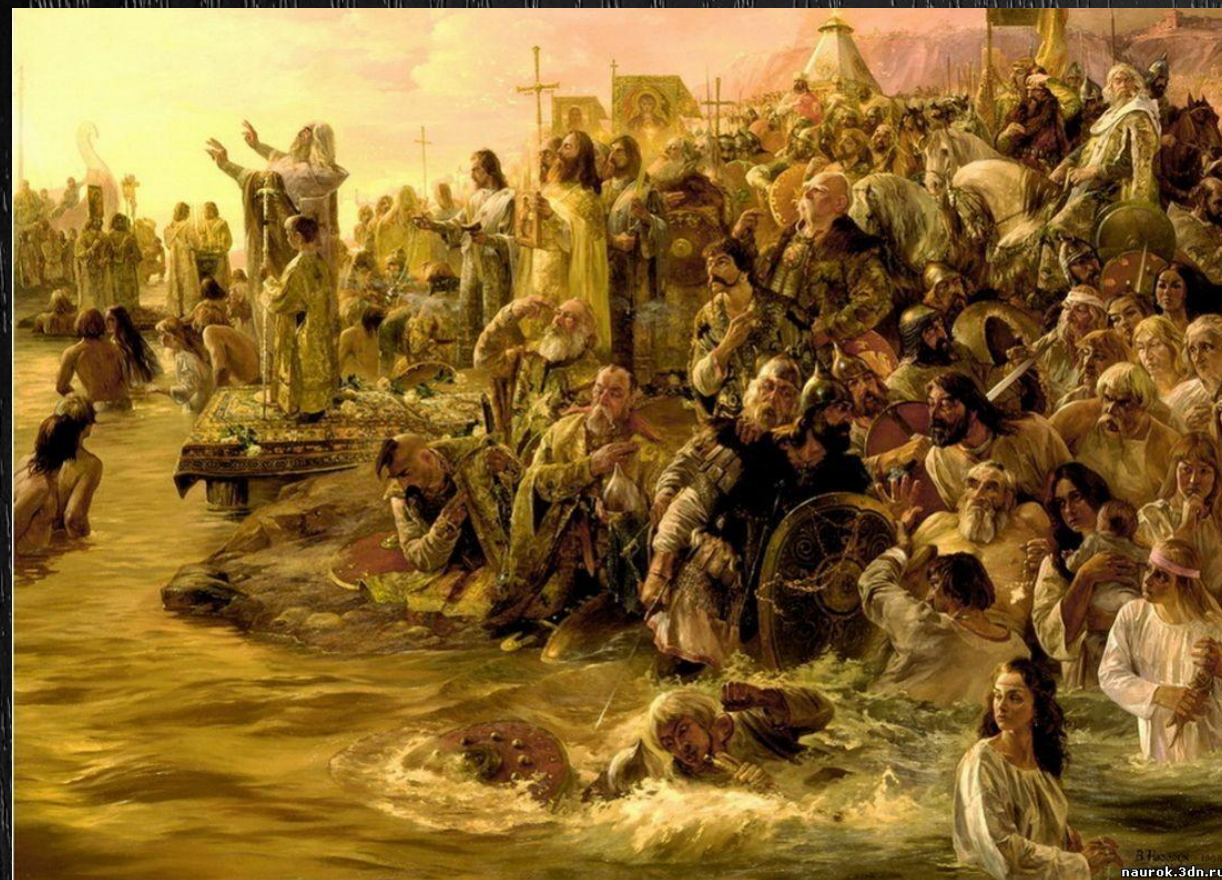
Крещение Руси. Назарук В.М