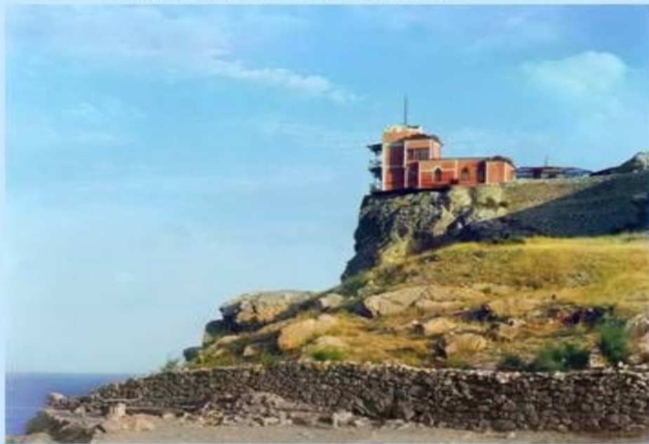
Замок «Ласточкино гнездо» XXI век.