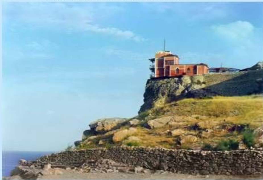
Замок «Ласточкино гнездо» Начало XX века.