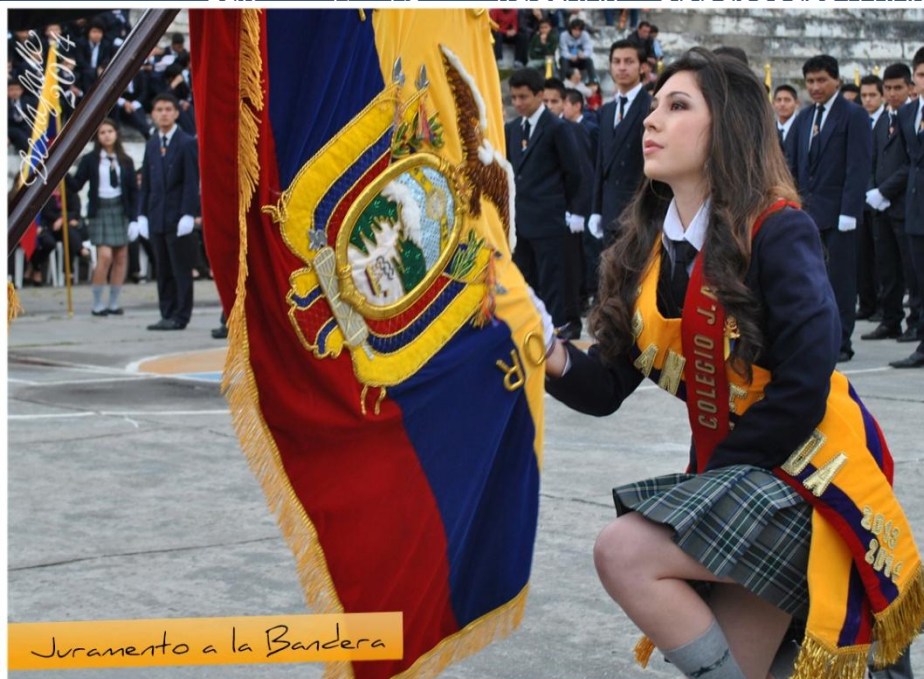
Juramento a la Bandera