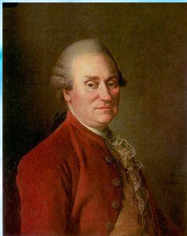
Марк Фёдорович Полторацкий