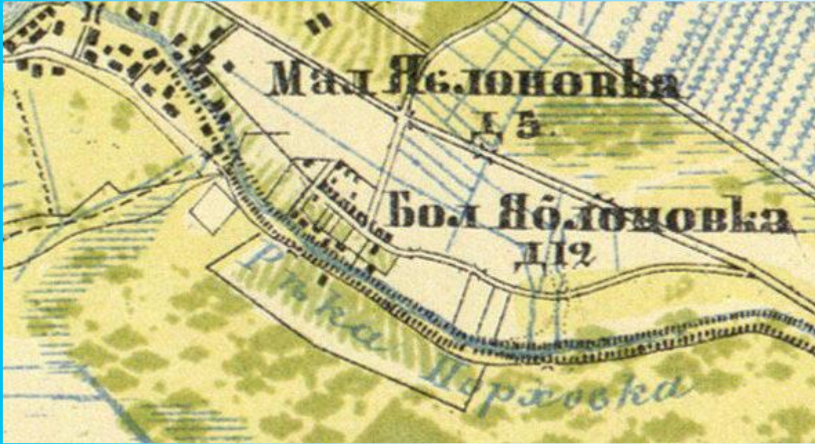
План Яблоновки. 1860 г.

В 1860 году деревня насчитывала 5 крестьянских дворов.