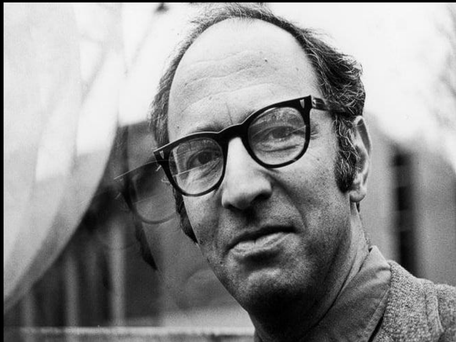
Томас Сэмюэл Кун – американский историк и философ науки

Каким же способом философия как феномен культуры может достичь этой цели? Здесь имеется в виду нечто гораздо большее, чем "подход", -- особый способ мышления, который проявляется в наши дни и в научном познании, и в техническом творчестве, и в проектной деятельности, и в медицинской, и в управленческой, все шире и глубже проникая в общественное сознание; неудивительно, что он захватывает и сферу философского умозрения. Обретение системным мышлением парадигмального -- говоря языком Т. Куна -- масштаба объясняется тем, что во второй половине XX века во всех областях культуры приходится иметь дело с целостными, сложными и сверхсложными системами, которые оказываются доступными познанию, преобразованию, управлению, проектированию именно в своей целостности, не допуская привычного аналитического расчленения и оперирования каждой частью порознь, ибо система есть нечто большее, чем сумма составляющих ее частей.