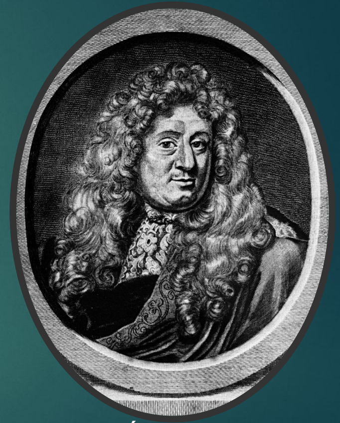
Самуэль фон Пуфендорф — немецкий юрист-международник, историк, философ, при жизни получивший международное признание.

На философском уровне размышления о сути культуры появляются сравнительно поздно -- пожалуй, лишь в XVII--XVIII веках, в учениях С. Пуфендорфа (первым дал определение термина "культура"), Дж. Вико, К. Гельвеция, Б. Франклина, И. Гердера, И. Канта. Человек определяется как существо, наделенное разумом, волей, способностью созидания, как "животное, делающее орудия", а история человечества -- как его саморазвитие благодаря предметной деятельности в самом широком спектре ее многообразных форм -- от ремесла и речи до поэзии и игры.