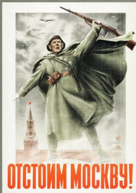
«Отстоим Москву!» 1941 год. Художники Н. Жуков и В. Климашин.