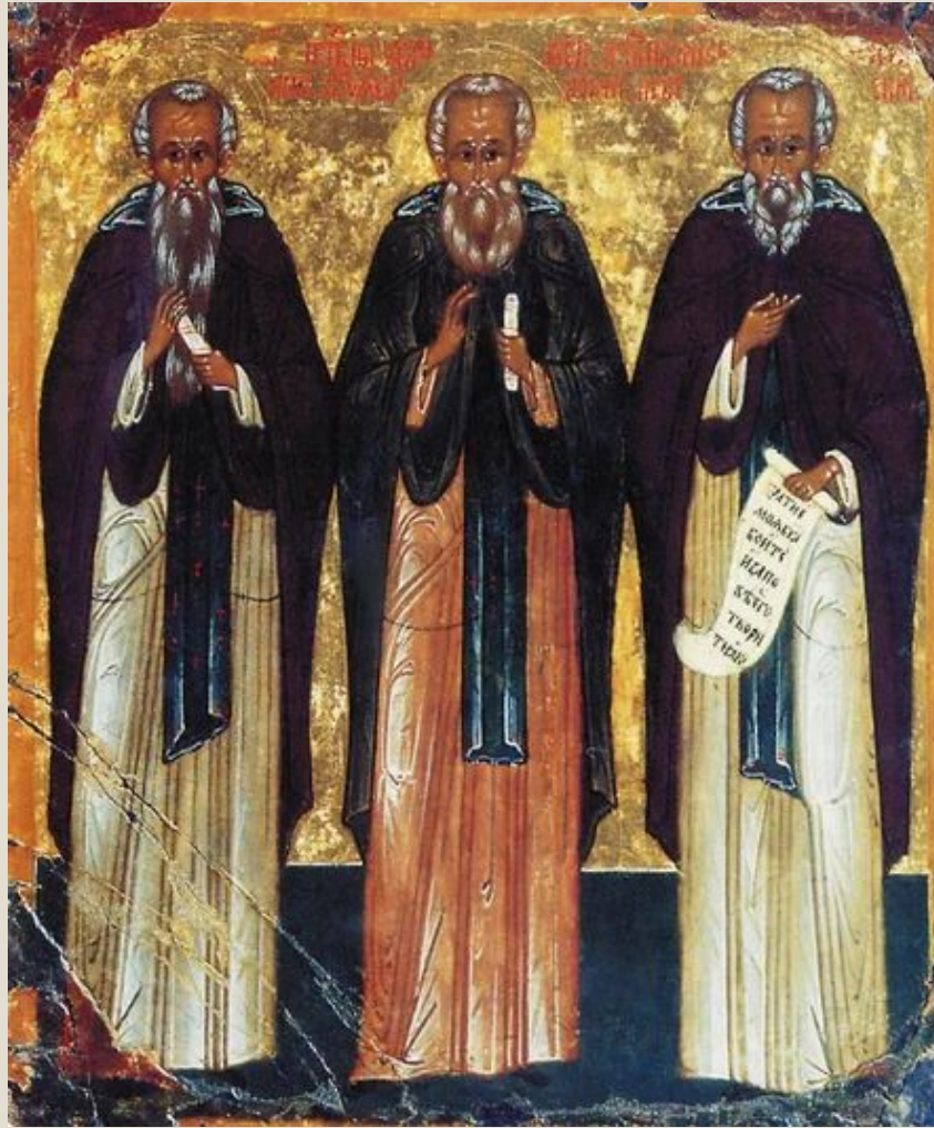
Одна из самых ранних икон, изображающих Александра Невского в монашеском облачении – новгородская табличка середины XVI века из собора св. Софии «Преподобные Иоанн, Авраамий Ростовский и Александр Невский» (Новгородский музей-заповедник).