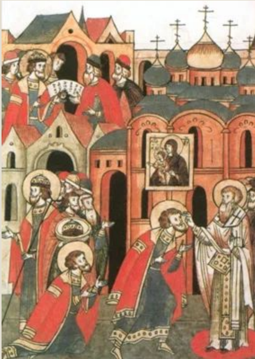
Молитва Александра Невского в храме Святой Софии и благословение его архиепископом перед битвой. Миниатюра Лицевого Летописного свода. Москва. XVI в.