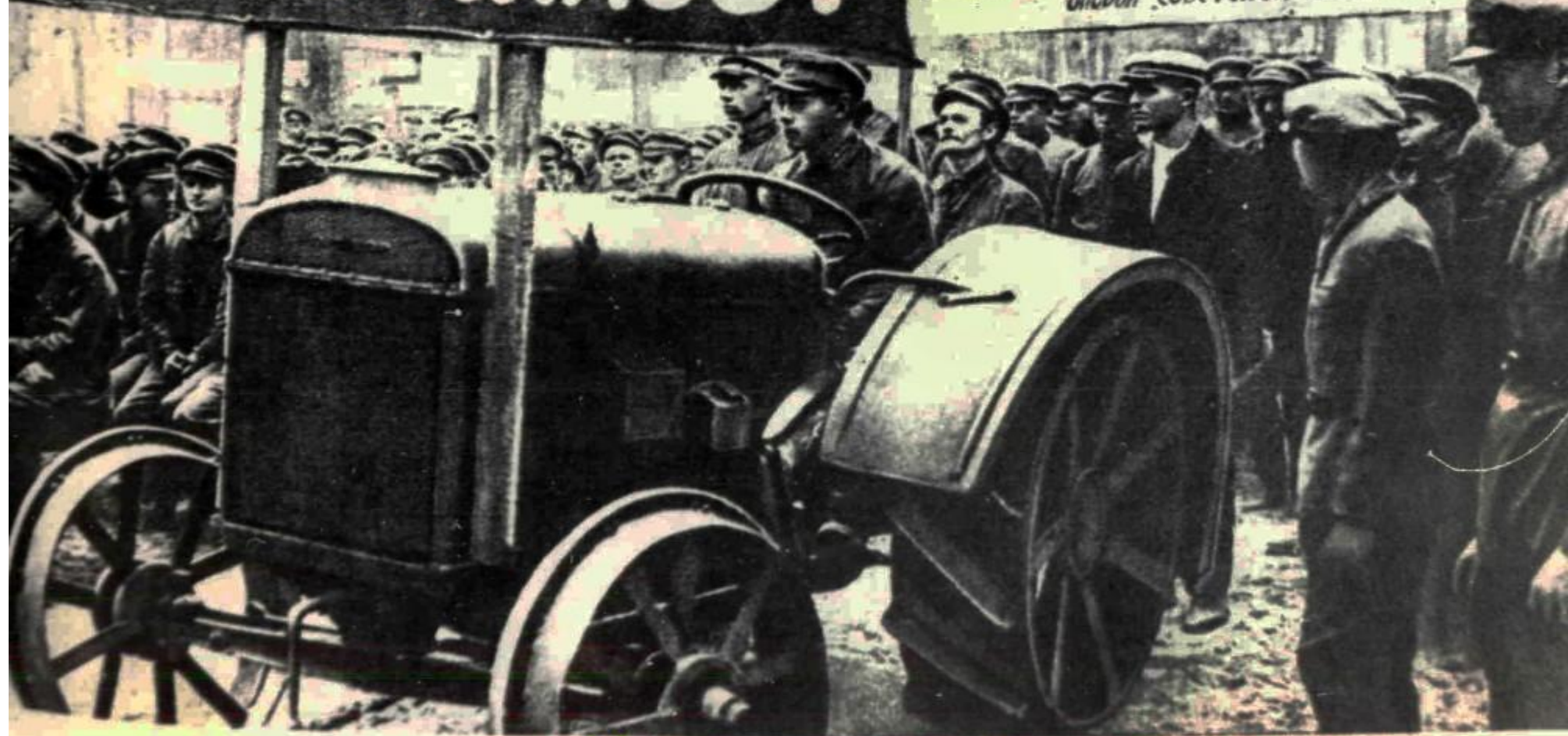
Агитработа среди красноармейцев на терсборах. 1930 г.

КРАСНОАРМЕЕЦ-КОЛХОЗНИК! ПРИЙДЕШЬ ДОМОЙ, ПОЙДИ ПО ДВОРАМ ЕДИНОЛИЧНИКОВ И ЗОВИ ИХ ТОЖЕ В КОЛХОЗ. Будь действительной и прочной опорой Советской власти!