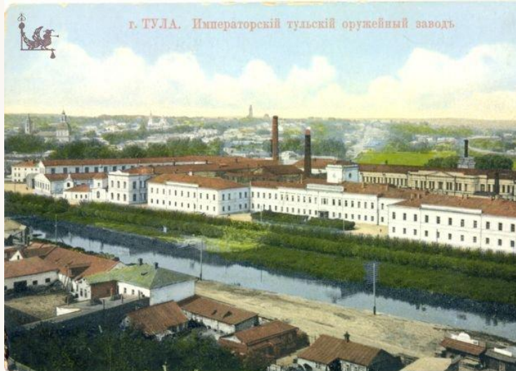
Тульский оружейный завод