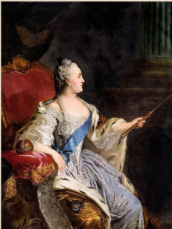
Екатерина II 1729–1796 гг.

При Екатерине II в 1762 г. были ликвидированы и торговые монополии (кроме соляной и водочной).