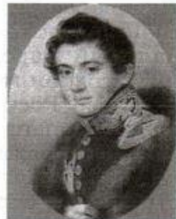
Н. М. Муравьев

14. Всякий имеет право излагать свои мысли и чувства невозбранно и сообщать оныя посредством печати своим соотечественникам...»