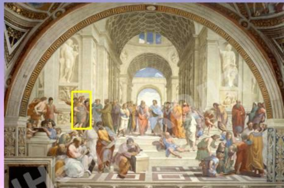
Алкивиад или Александр Македонский