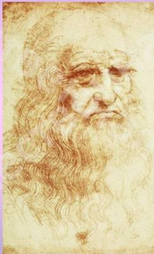
Леонардо да Винчи