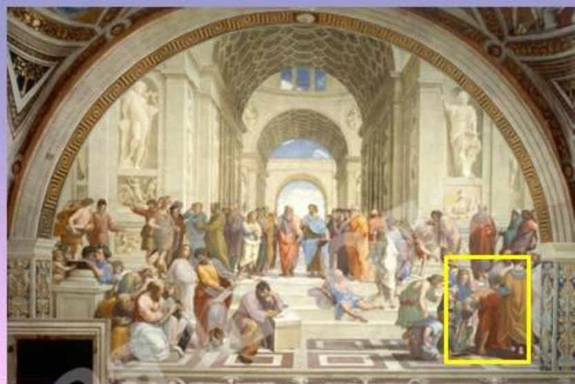
Донатто Браманте в образе Архимеда