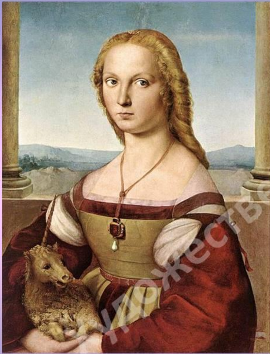
«Дама с единорогом»

Помимо мадонн, Рафаэль был великолепным портретистом своего времени. Многие усматривают сходство с портретом Леонардо да Винчи.