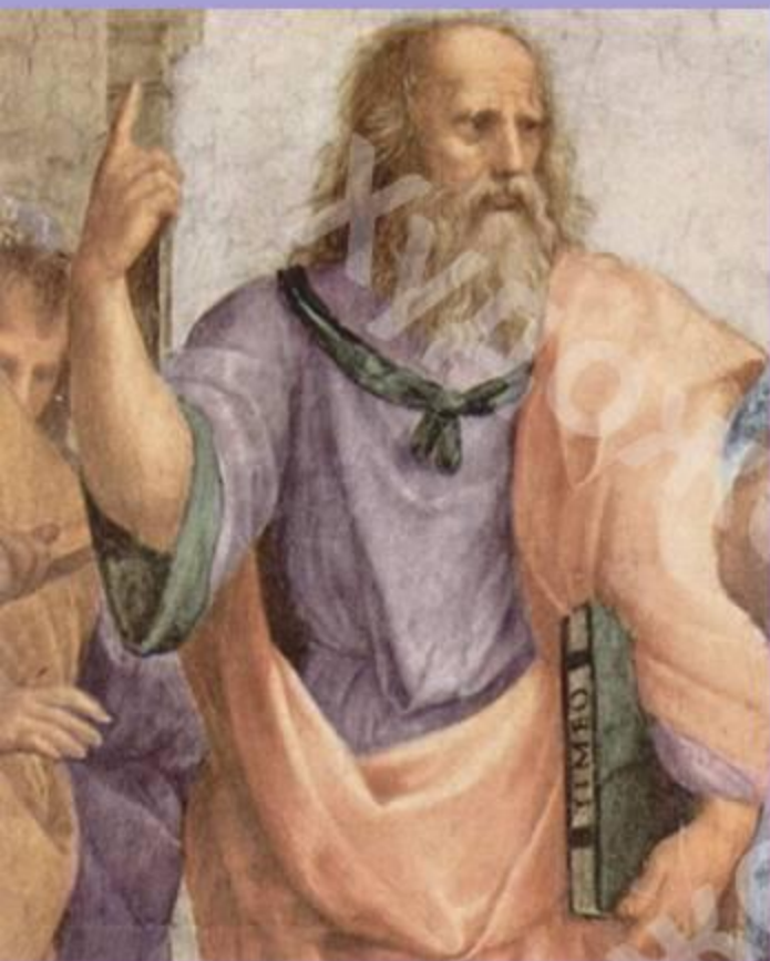
Леонардо да Винчи в образе Платона