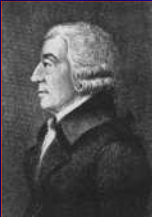
Адам Смит (1723-1790)