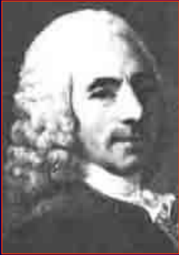
Ф. Кенэ (1694-1774)

Представителями классической политической экономики во Франции в XVIII в. были Франсуа Кенэ и Анн Робер Жак Тюрго. Они перенесли вопрос о происхождении общественного богатства из сферы обращения в сферу производства. При этом ограничивали последнюю только сельским хозяйством, считая, что богатство создается лишь в этой отрасли.