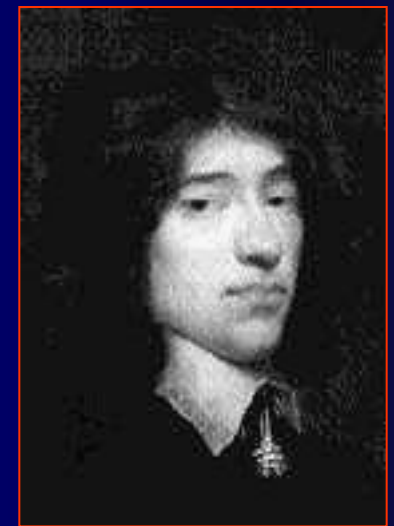
Уильям Петти 1623 - 1687