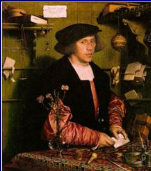
Ганс Гольбейн Младший. Георг Гизе, немецкий купец в Лондоне (1532 г.)

Первое течение экономической мысли в XV - XVII в.в. - меркантилизм (от итальянского "мерканте" - торговец, купец)- заключалось в познании закономерностей торговли.