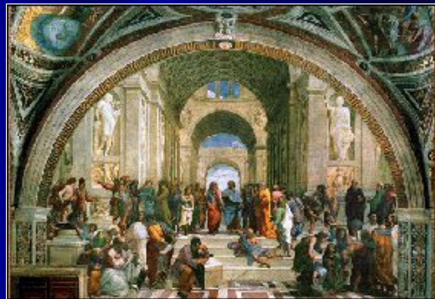
Рафаэль Санти «Афинская школа»