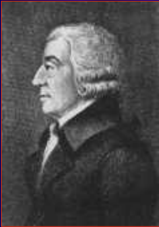
Адам Смит (1723-1790)