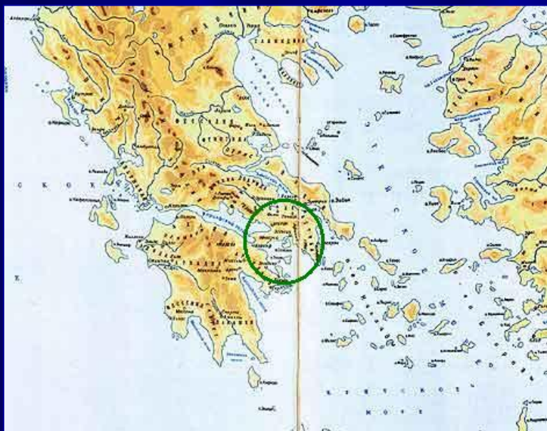
Греция. Полуостров Атика. Афины.

Первые попытки теоретически осмыслить экономическое устройство общества были сделаны в сочинениях Ксенофонта (430-335 г.г. до н.э.), Платона (428-348 г.г. до н.э.) и в учении Аристотеля (384-322 г.г. до н.э.).