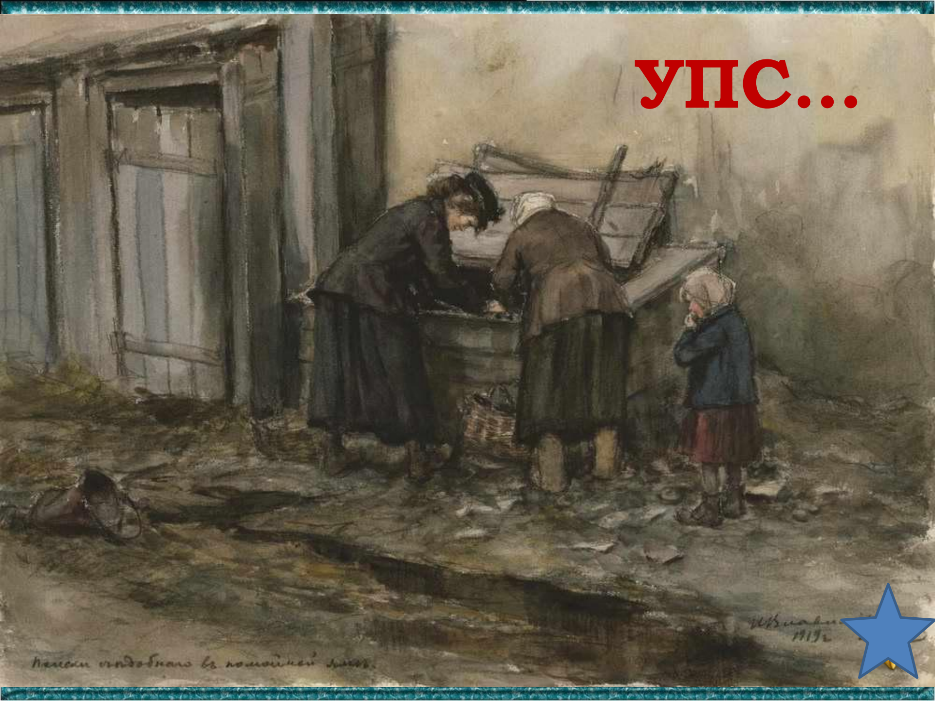
Нелюди подобнаго въ помойной ямѣ.