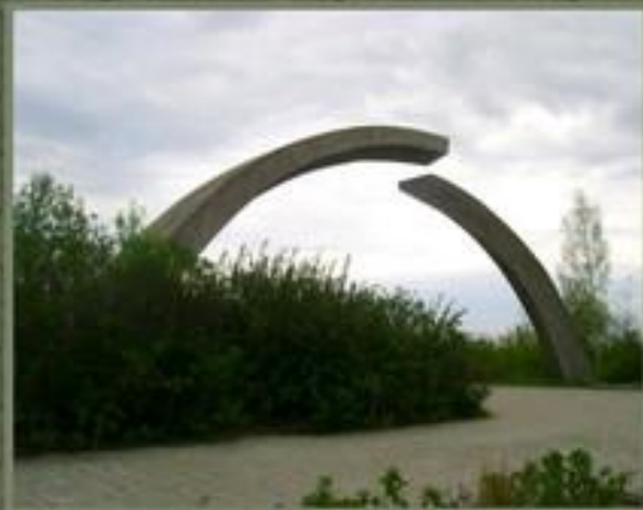
Памятник в честь разрыва блокады Ленинграда.

Блокада Ленинграда стала самой кровопролитной осадой в истории человечества