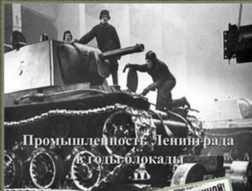
Промышленность Ленинграда в годы блокады

Голодные измученные люди находили в себе силы работать.