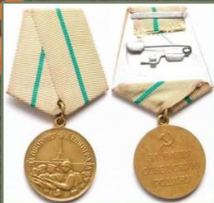
Медаль за оборону Ленинграда

Указом Президиума Верховного Совета СССР Город-герой Ленинград был награждён орденом Ленина и медалью «Золотая Звезда».