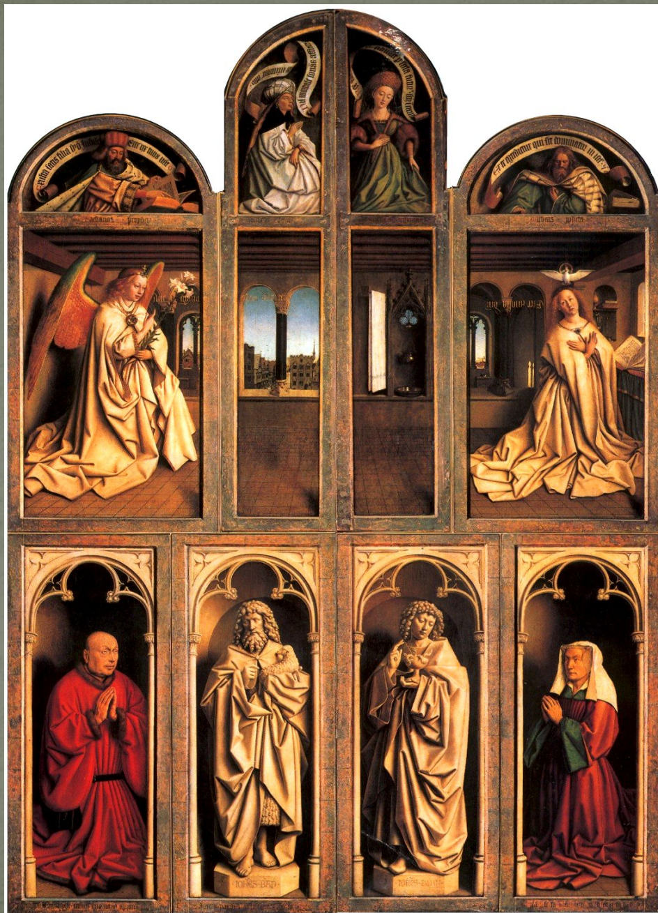
Гентский алтарь в закрытом виде