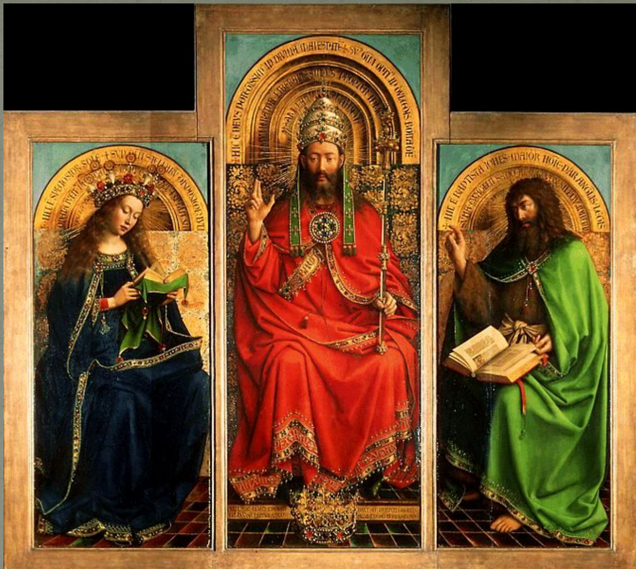
Бог-Отец, сидящий на престоле