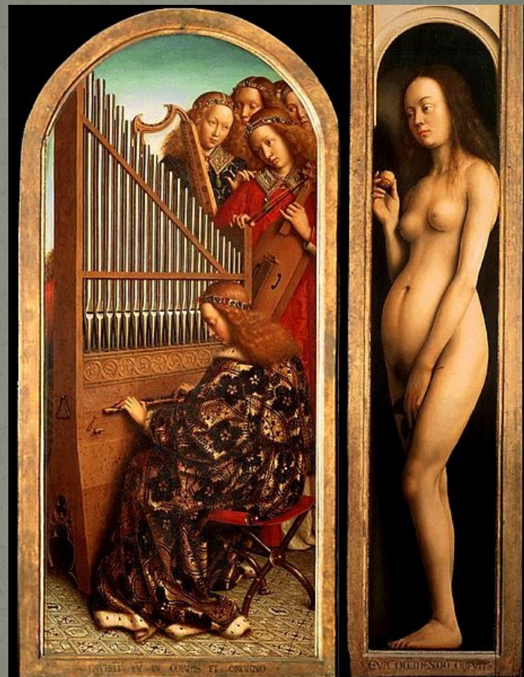
Ангелы и Ева