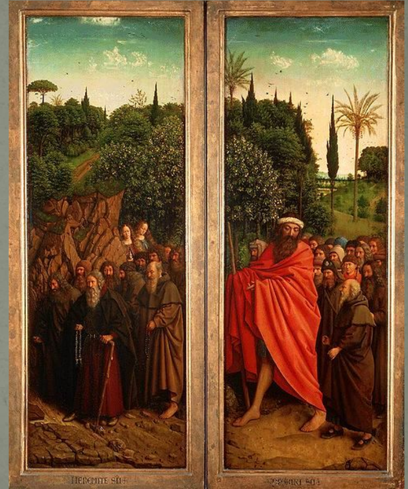
Щестье отшельников и лихорадка