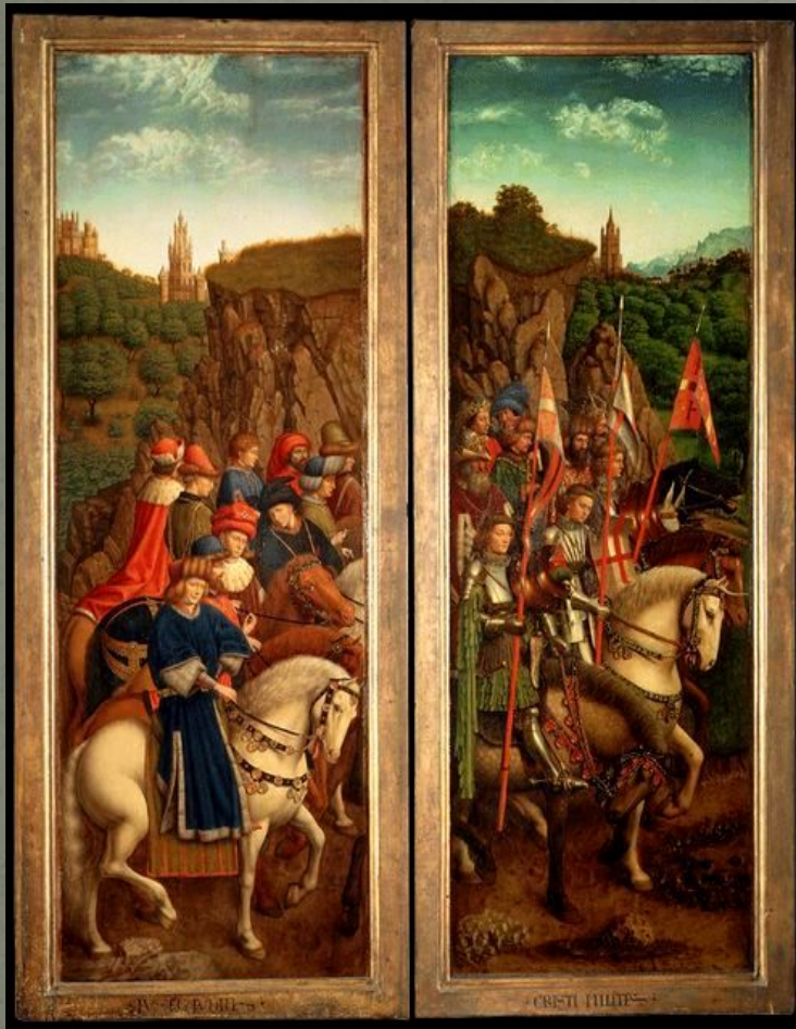
Праведные Судьи и Воинство Христово