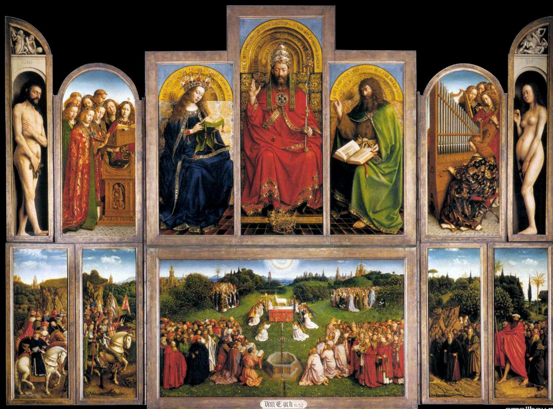
Van Eyck 1432