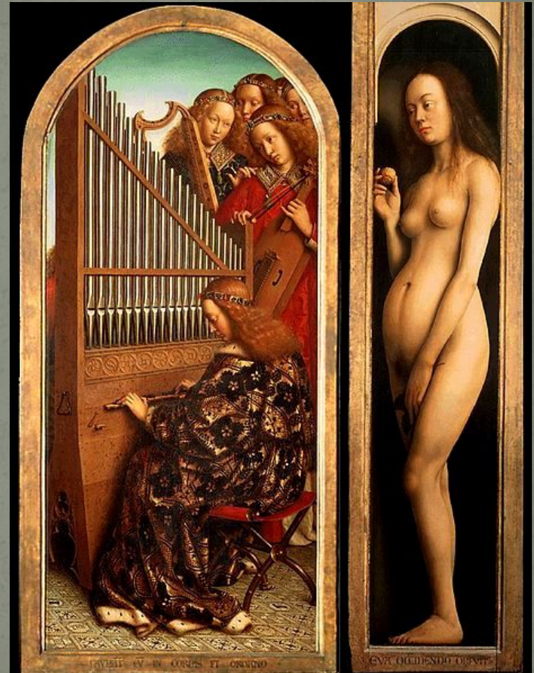
Ангелы и Ева