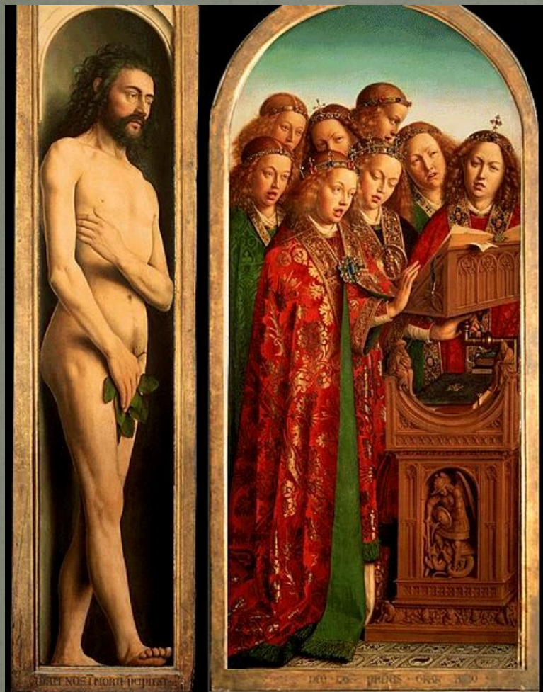
Адам и ангелы