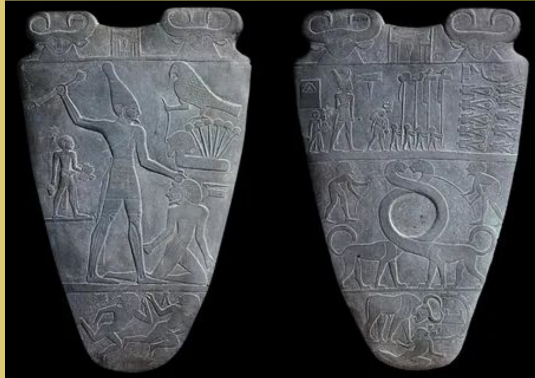
Обе стороны палитры Нармер ; с. 3100 г. до н.э .; грейваке ; высота: 63 см; из Иераконполиса (Египет); Египетский музей ( Каир )