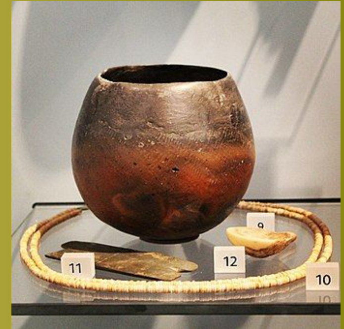
Бадарское захоронение. 4500–3850 гг. До н. Э.