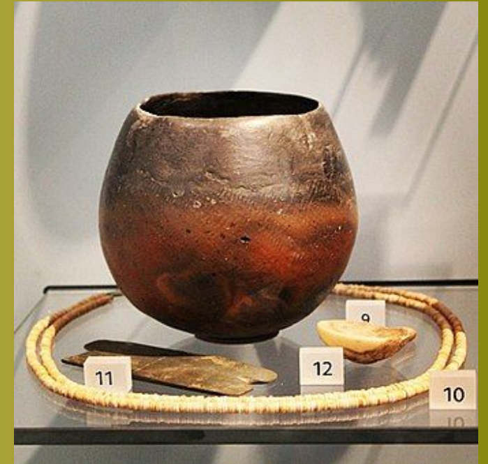
Бадарское захоронение. 4500–3850 гг. До н. Э.