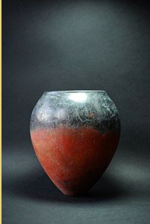
Яйцевидная, черная верхом керамическая плитка ваза (с. 3800-3500 до н.э.)