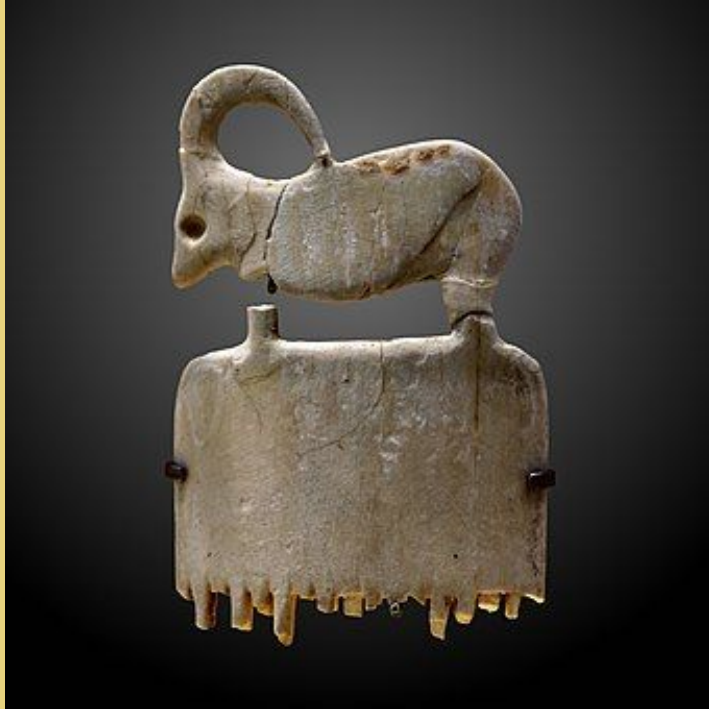
Гребешок козерога ; 3800–3500 гг. До н. Э .; слоновая кость гиппопотама; 6,5 × 3,8 × 0,2 см; Лувр