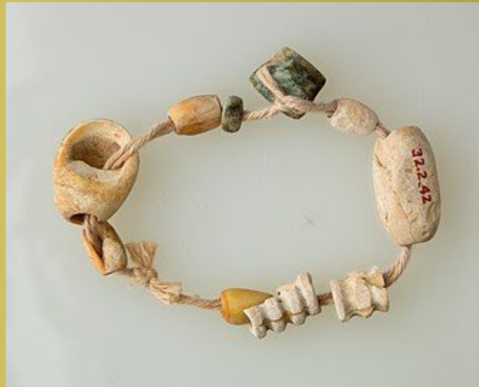
Бусы; 4400–3800 гг. До н. Э .; бусины сделаны из кости, серпентинита и ракушки; длина: 15 см; Метрополитен-музей