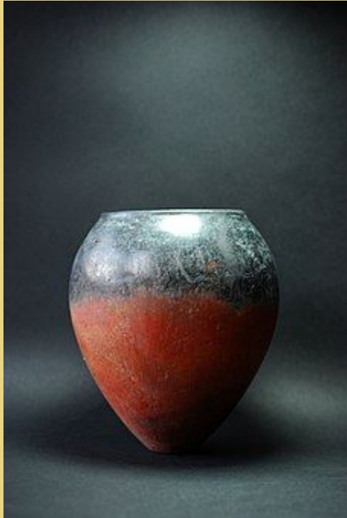
Яйцевидная, черная верхом керамическая плитка ваза (с. 3800-3500 до н.э.)