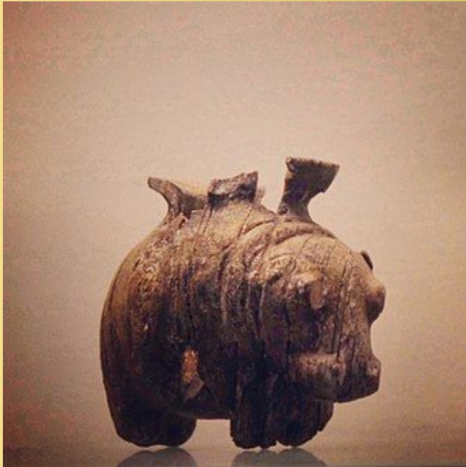
Ваза в виде бегемота. Ранний додинастический, Бадарян. 5 тысячелетие до нашей эры.