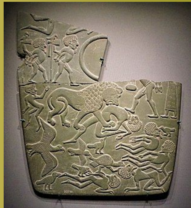
Палитра; 3100 г. до н.э.; аргиллиты; ширина: 28,7 см, глубина: 1 см; из Абидоса (Египет); Британский музей (Лондон)