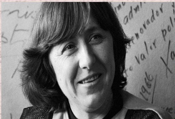
Автор книги «У войны не женское лицо» Светлана Алексиевич родилась 31 мая 1948 года в городе Ивано-Франковске (Украина)