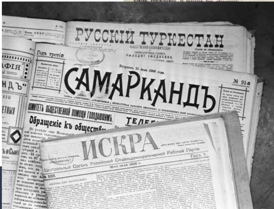
Газета “Русский Туркестан”