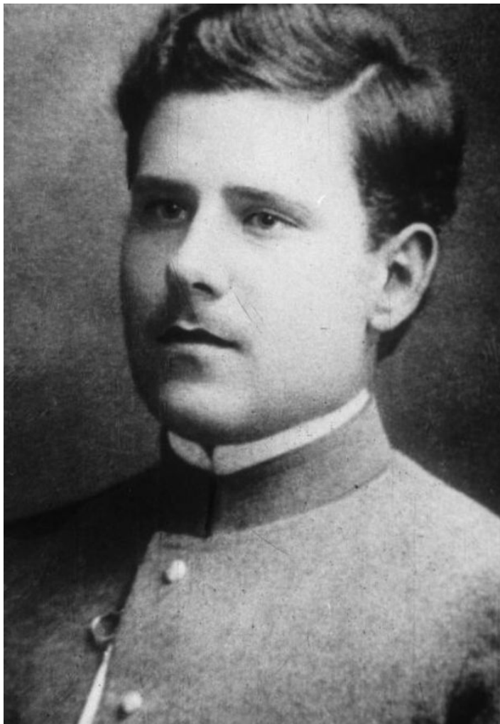
Максимилиан Волошин во времена обучения в гимназии.