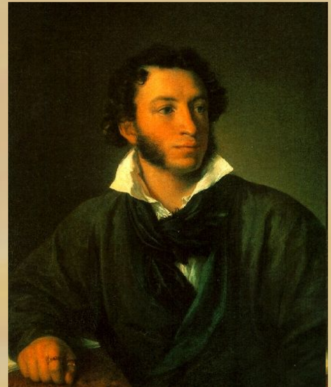
Портрет маслом В. Тропина, 1827 г.