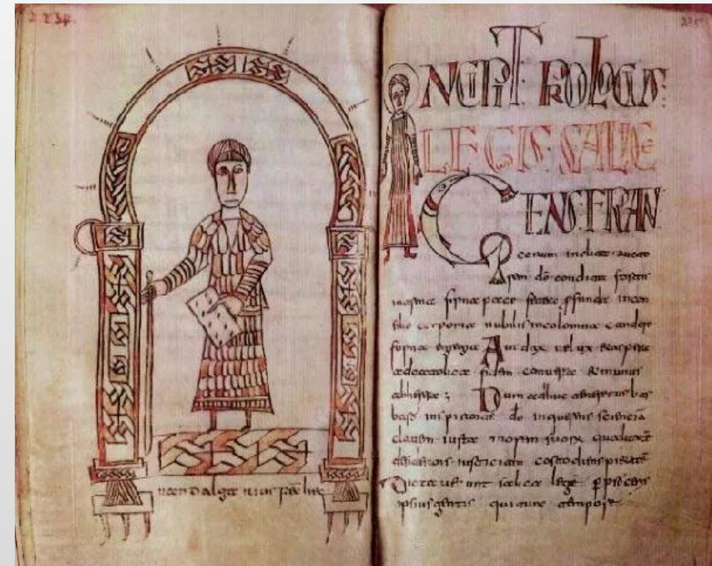
Глава из Салической правды