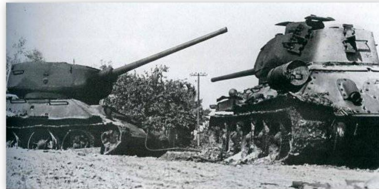
Танки Т34 против Тигров.