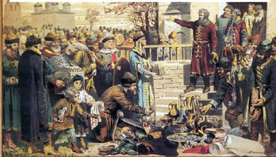
Воззвание Козьмы Минина к нижегородцам

Осенью 1611 г. по призыву нижегородского купеческого старосты К. Минина началось формирование народного ополчения.