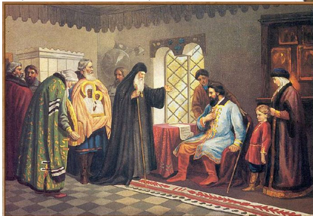
Нижегородские послы у князя Дмитрия Пожарского. 1611 г.