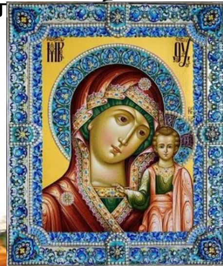
Праздник Казанской иконы Божьей Матери