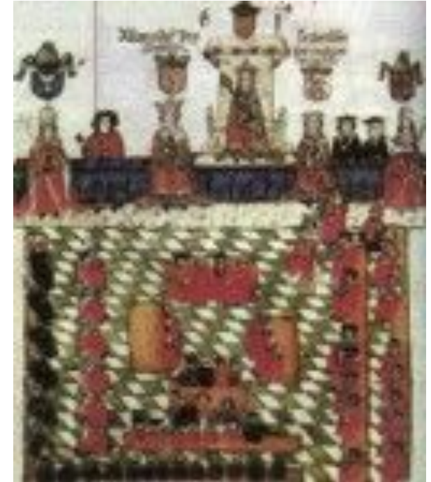
Эдуард I в парламенте