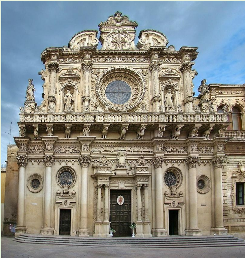
Базилика дель Санта Кроче, Лечче, Италия.