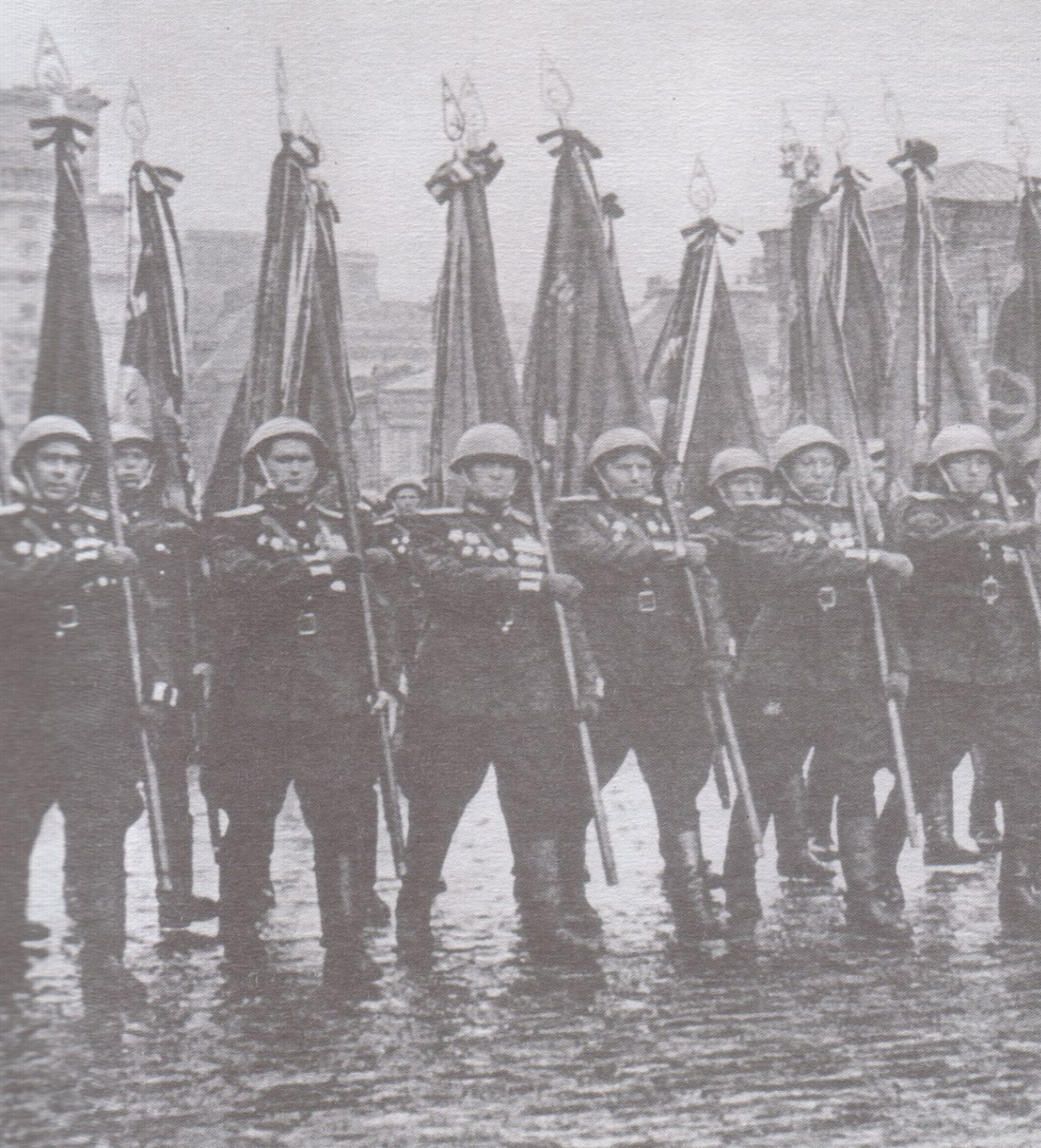
Парад Победы на Красной площади, 24 июня 1945г.