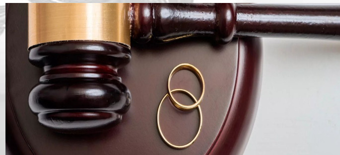
Путешествие по семейному праву