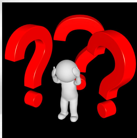
Что он совершил?