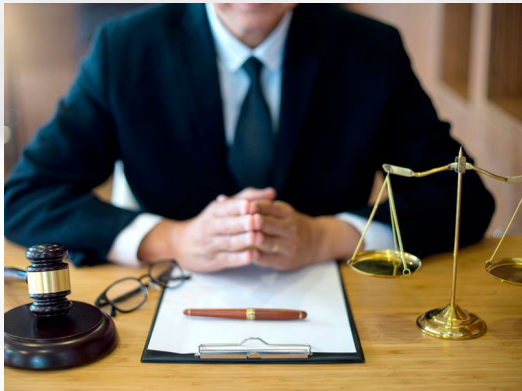
Мир Юридической консультации