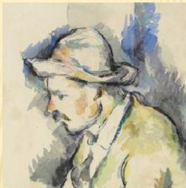
П.Сезанн. «Игрок в карты»