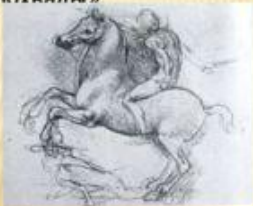
Леонардо да Винчи

«Делай фигуры с такими жестами, которые достаточно показывали бы то, что творится в душе фигуры, иначе твое искусство не будет достойно похвалы»