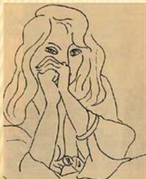
А.Матисс. «Женщина с распущенными волосами»

Назовите, к каким видам изобразительного искусства относятся эти наброски?