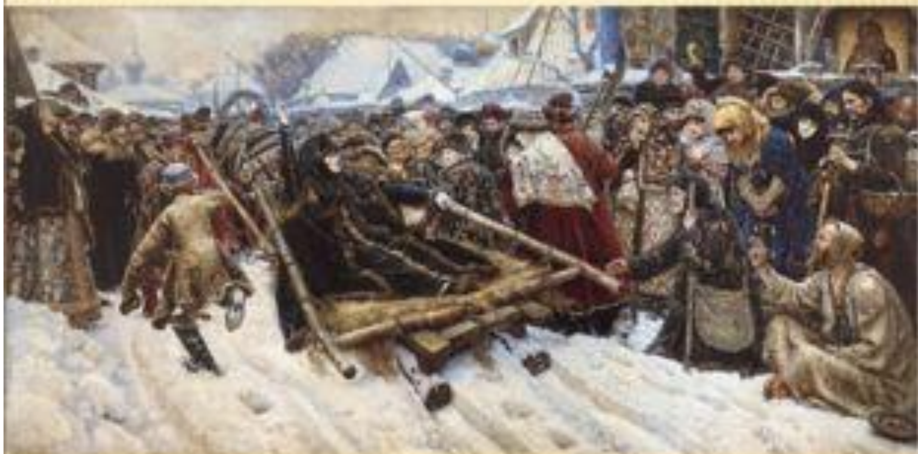
В. Суриков «Боярыня Морозова» 1887 г.