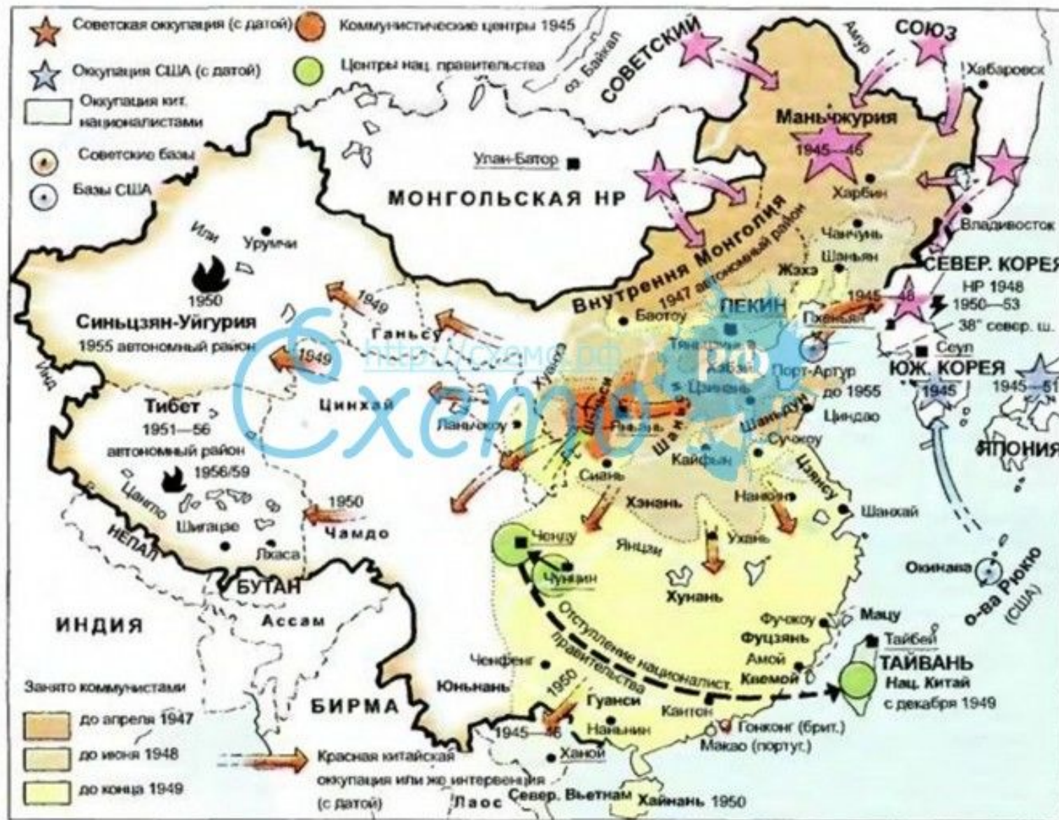
Гражданская война в Китае в 1945—1950