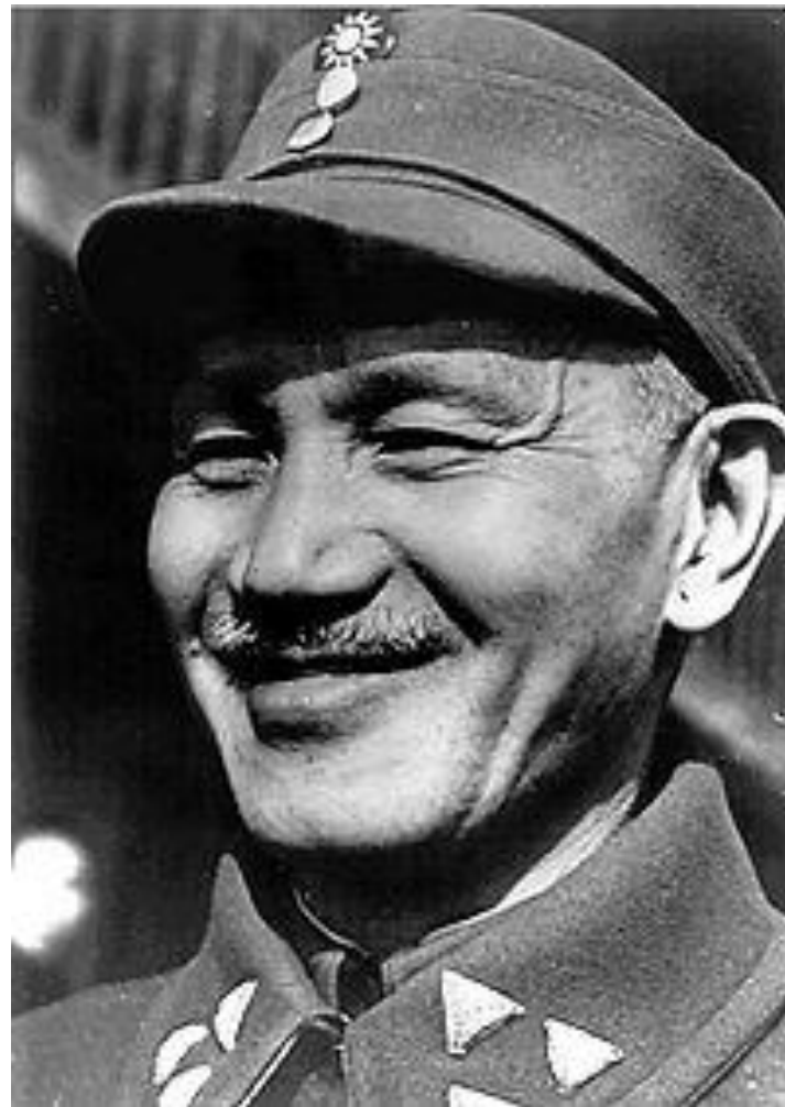
Чан Кайши 31 октября 1887 — 5 апреля 1975

Режим Чан Кайши имел определенные преимущества. Он контролировал большую часть территории страны (76 %), имел многочисленную армию, оснащенную при поддержке США (ок. 4,3 млн человек). Гоминьдан поддерживали провинциальные магнаты, ростовщики и помещики.