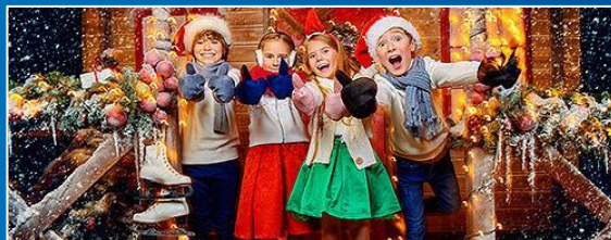
ПРОВЕДЕНИЕ МЕРОПРИЯТИЙ И ПРАЗДНИКОВ