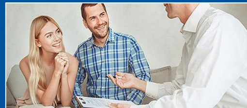
СДАЧА КВАРТИРЫ В АРЕНДУ ПОСУТОЧНО ИЛИ НА ДОЛГИЙ СРОК