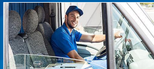
УСЛУГИ ПО ПЕРЕВОЗКЕ ПАССАЖИРОВ И ГРУЗОВ