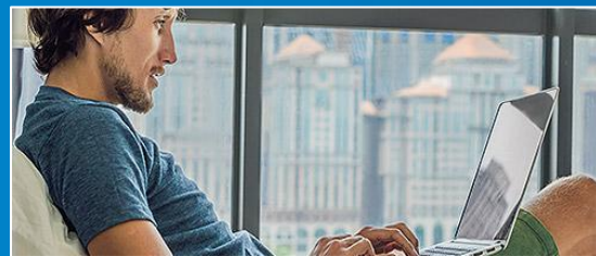
УДАЛЕННАЯ РАБОТА ЧЕРЕЗ ЭЛЕКТРОННЫЕ ПЛОЩАДКИ