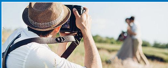
ФОТО И ВИДЕОСЪЕМКА НА ЗАКАЗ