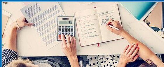
ЮРИДИЧЕСКИЕ КОНСУЛЬТАЦИИ И ВЕДЕНИЕ БУХГАЛТЕРИИ