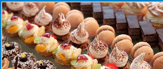
РЕАЛИЗАЦИЯ ПРОДУКЦИИ СОБСТВЕННОГО ПРОИЗВОДСТВА