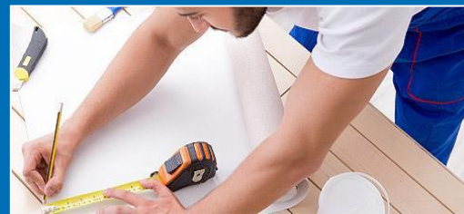
СТРОИТЕЛЬНЫЕ РАБОТЫ И РЕМОНТ ПОМЕЩЕНИЙ