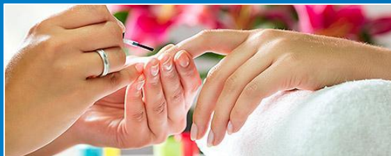
ОКАЗАНИЕ КОСМЕТИЧЕСКИХ УСЛУГ НА ДОМУ