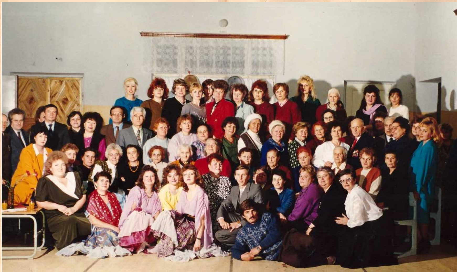
Октябрь, 1994 год. Празднование 40-летнего юбилея средней школы №26

В день празднования 40-летия школы в 1994 году коллектив не забыл пригласить одного из первых своих директоров.