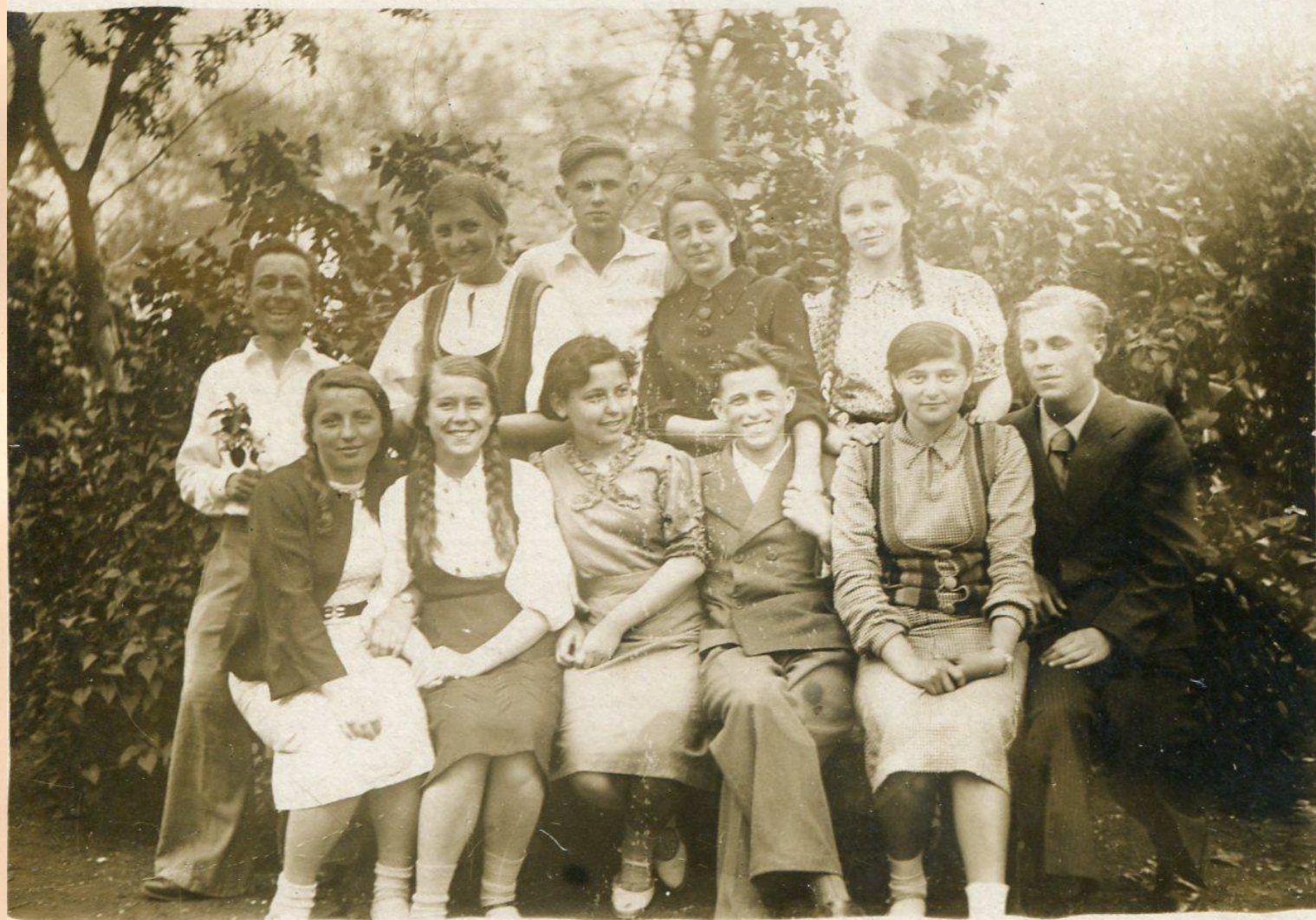
Июнь 1941 года. Выпускной 10 класс Гуляйпольской средней школы №1. Многие из них погибли в огне войны.