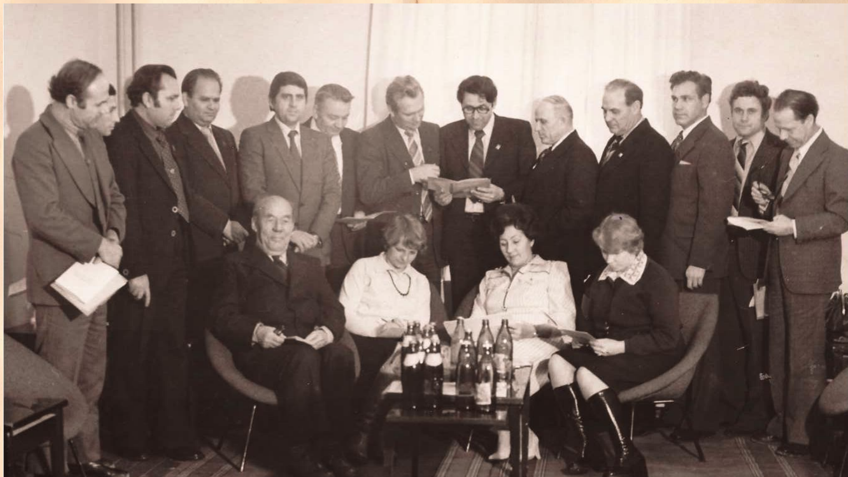
Ноябрь, 1980 год. Участники Тракторозаводской районной партийной конференции