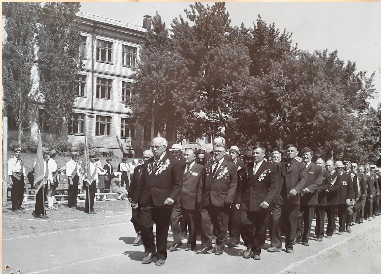
Май, 1982 год. Боевой строй ветеранов 124 отдельной стрелковой бригады.