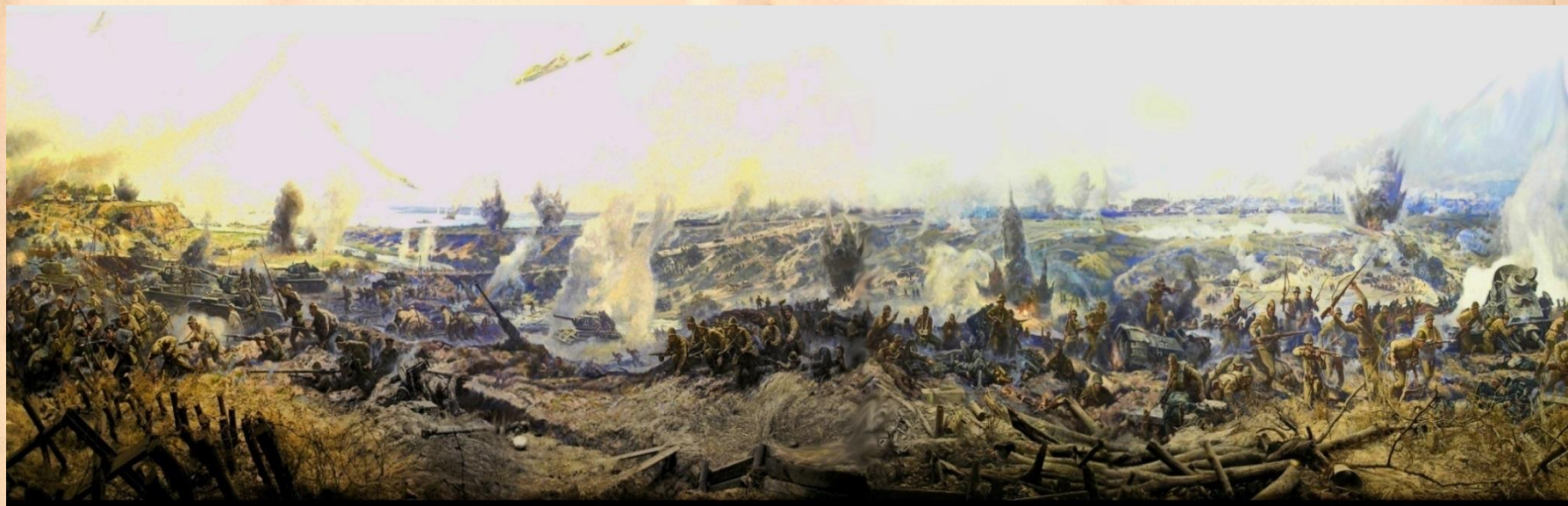
Диорама «Героическая оборона Сталинграда на тракторозаводских рубежах»