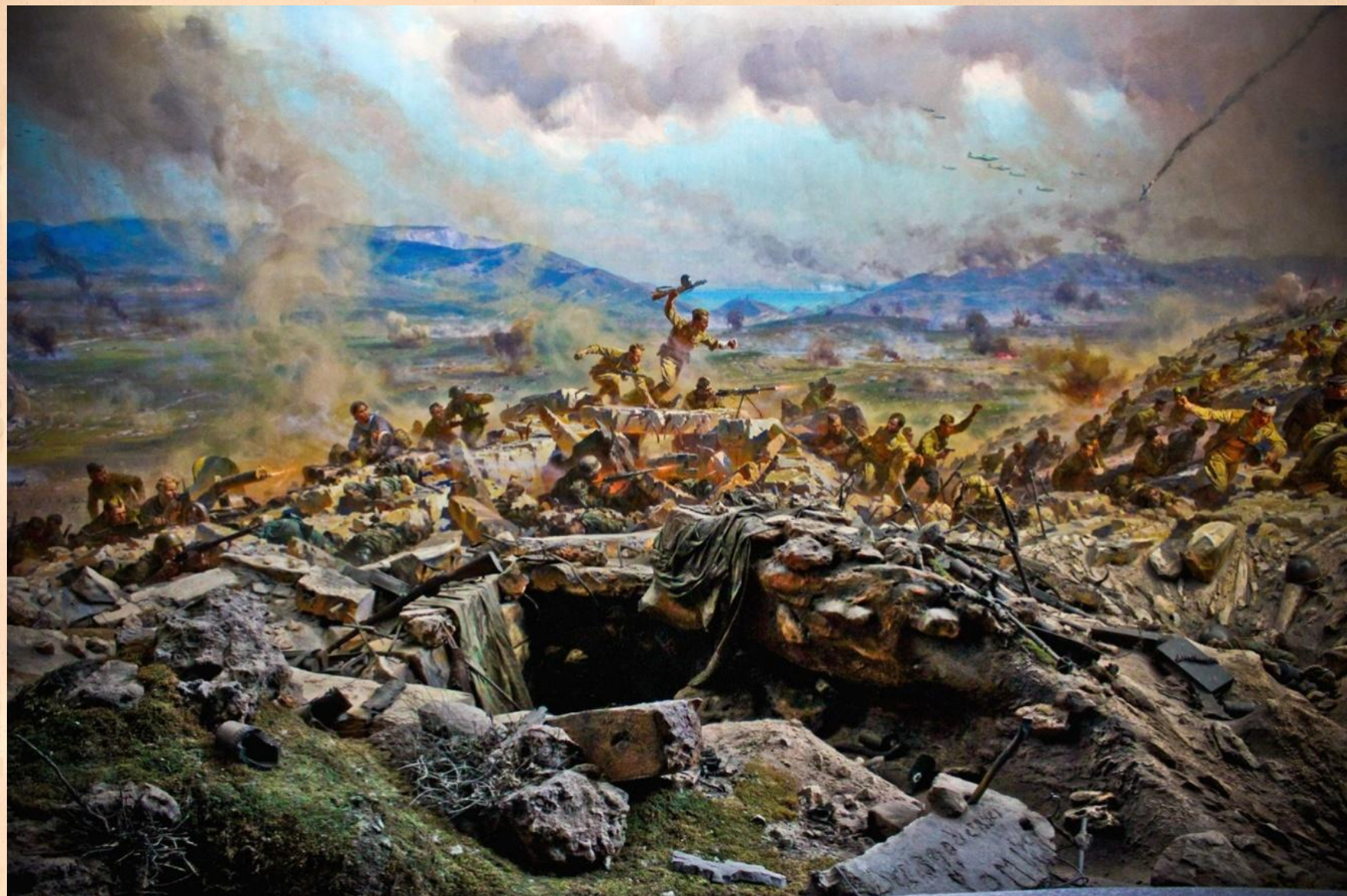
ДЕЙСТВИЯ ВЗВОДА РАЗВЕДКИ, ГДЕ СЛУЖИЛ Ф.Ф. СЛИПЧЕНКО, ПОКАЗАНЫ НА ДИОРАМЕ «ШТУРМ САПУН-ГОРЫ 7 МАЯ 1944 ГОДА»