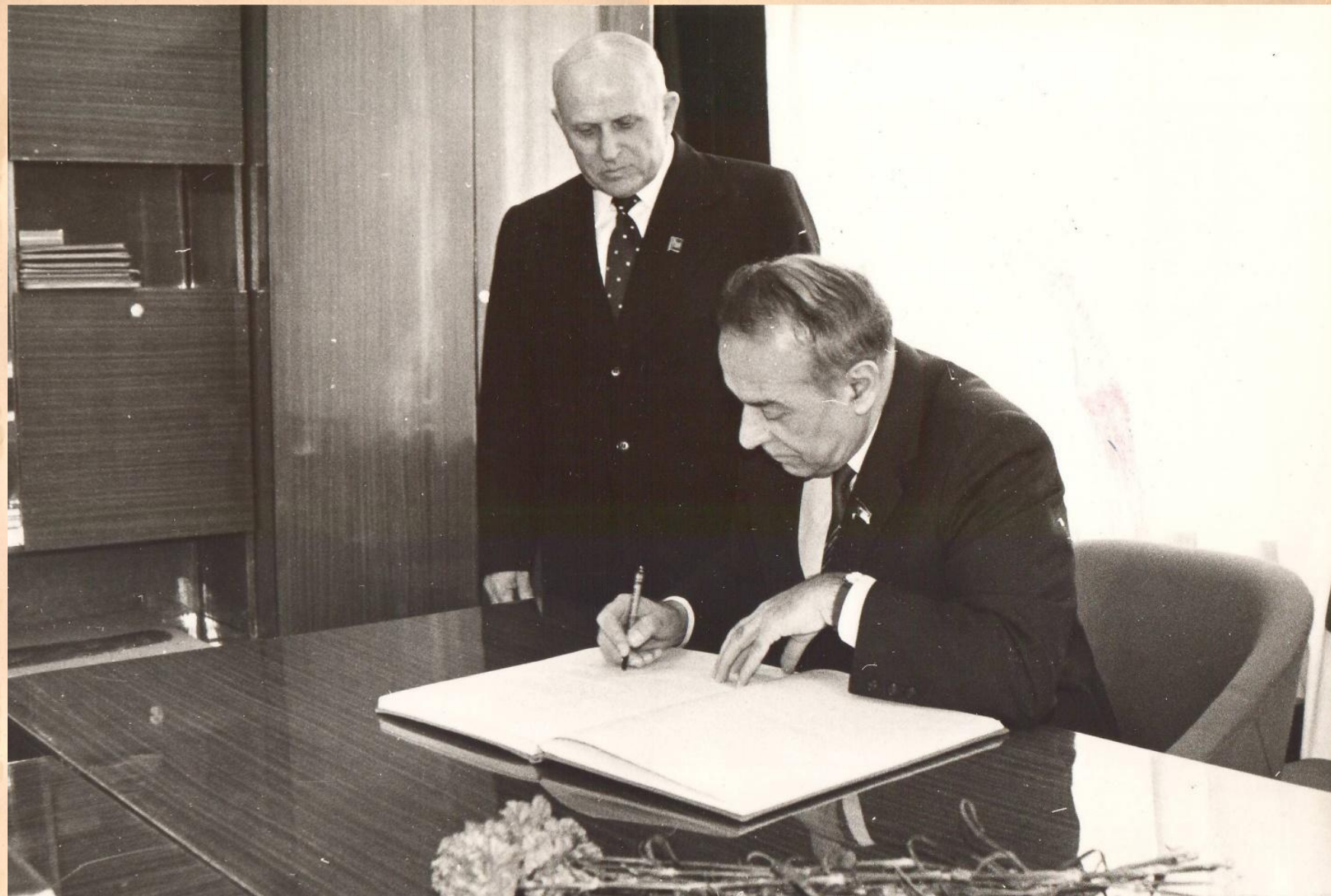
Будущий президент Азербайджана оставил в книге Почетных посетителей запись, где высоко оценил военно-патриотическую работу в школе-интернате.