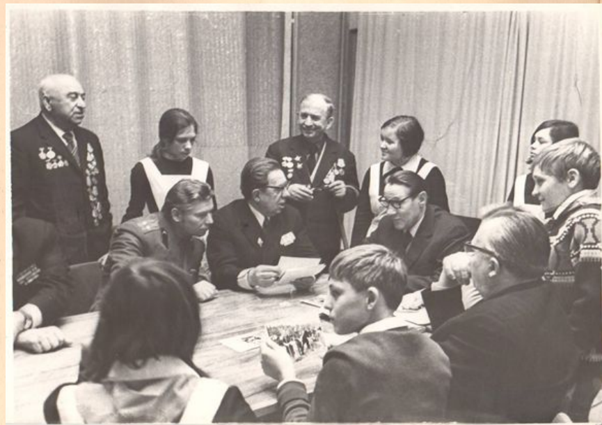
ДУШЕВНЫЙ РАЗГОВОР С ВЕТЕРАНАМИ