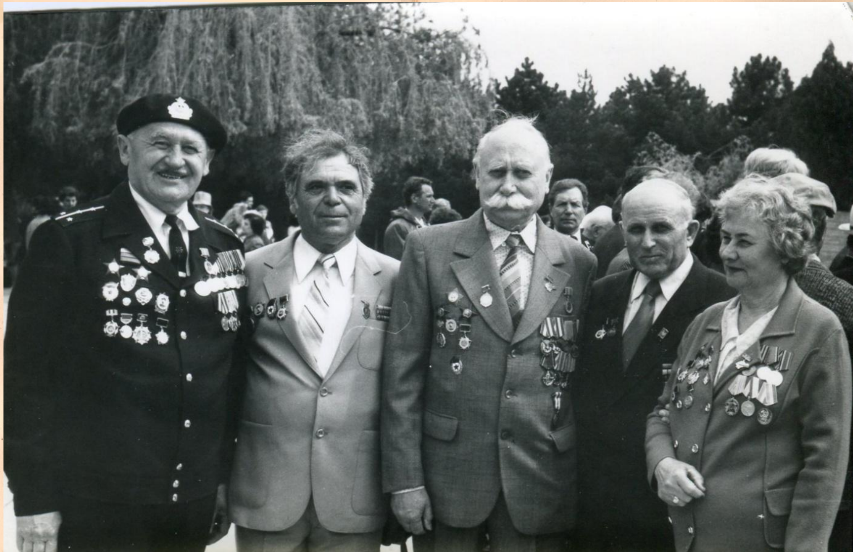
Май 1969 года. Встреча ветеранов 257 стрелковой дивизии 51 Армии