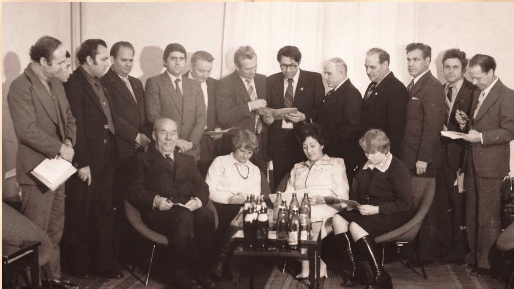
Ноябрь, 1980 год. Участники Тракторозаводской районной партийной конференции