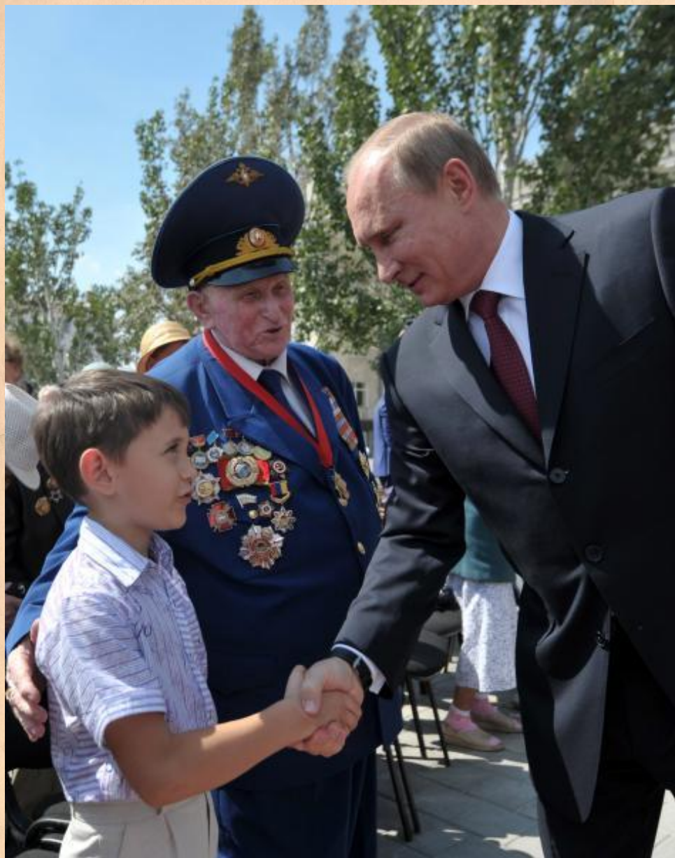
Волгоград. Открытие фонтана «Детский хоровод» 23 августа 2013 года.

В СЕМЕЙНОМ АЛЬБОМЕ ХРАНИТСЯ ФОТОГРАФИЯ – СВИДЕТЕЛЬСТВО ТОГО, ЧТО ДЕЛО ФЁДОРА ФЁДОРОВИЧА БУДЕТ ПРОДОЛЖЕНО. В СЕМЬЕ ПОДРАСТАЕТ ПРАВНУК ФЁДОР.