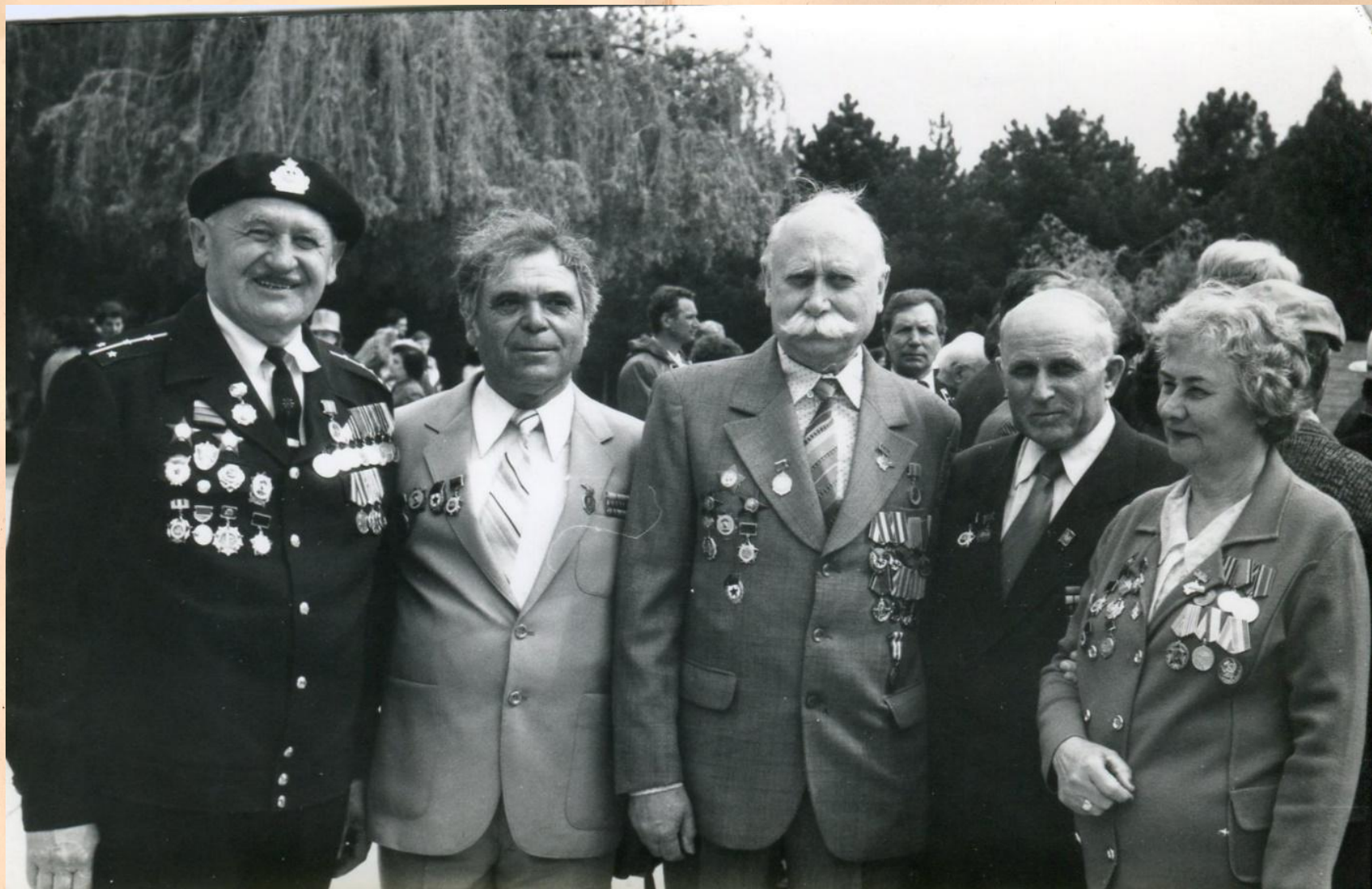
Май 1969 года. Встреча ветеранов 257 стрелковой дивизии 51 Армии