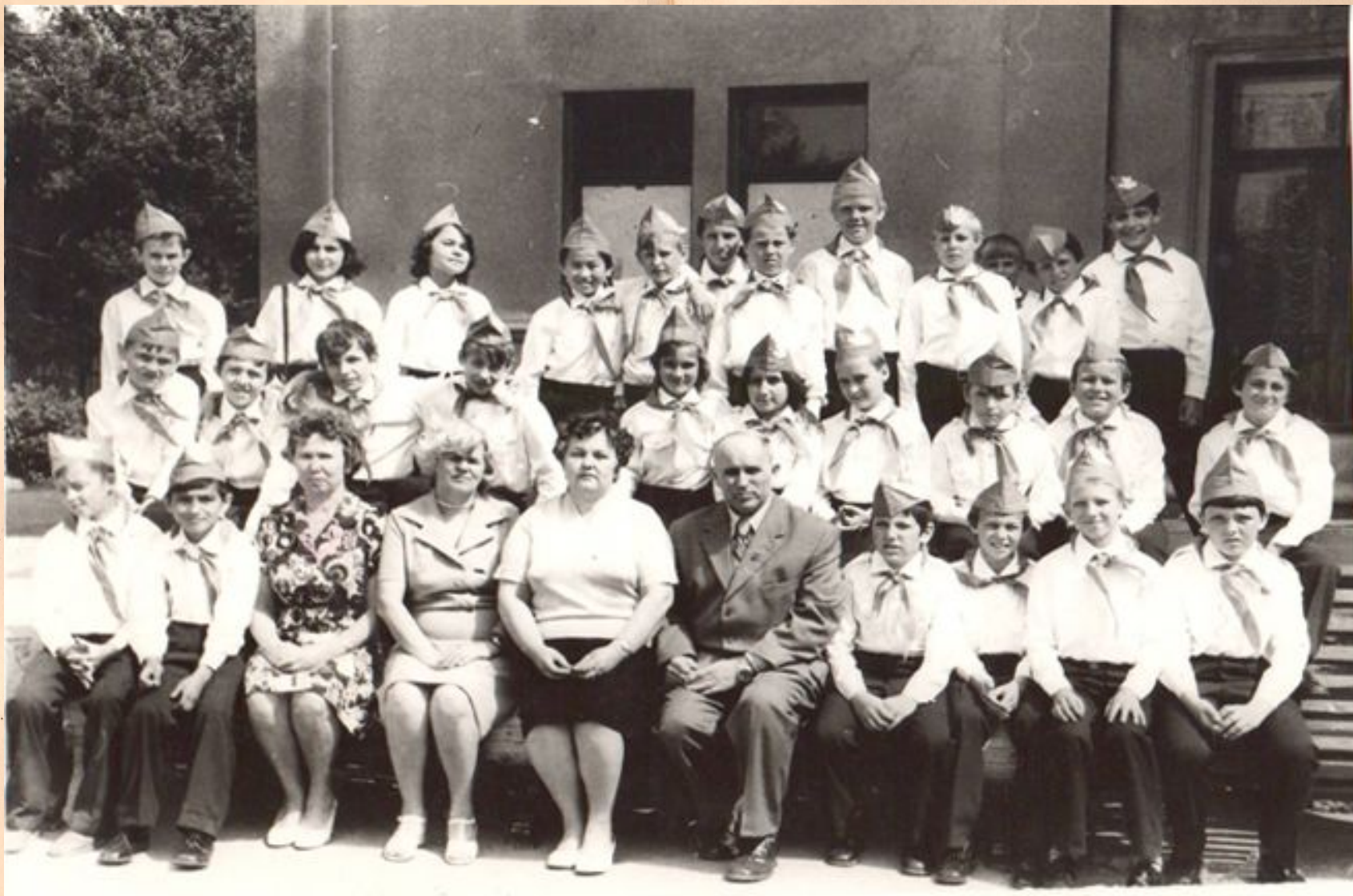
Фото с учениками и воспитателями 5 «Б» класса.

В 1970 году Ф.Ф. Слипченко был назначен директором школы-интерната №4.