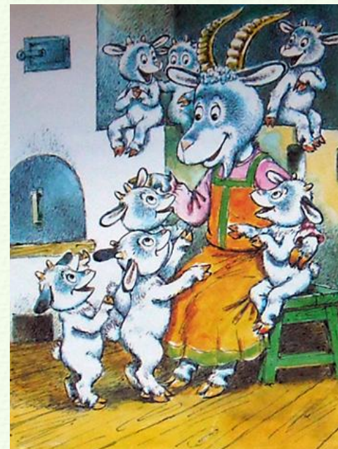
Рисунок А. Савченко