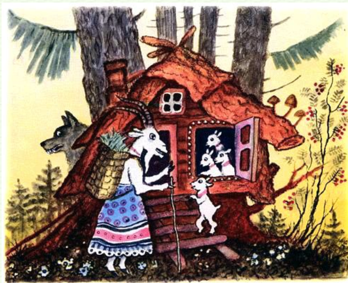
Рисунок Ю.А. Васнецова