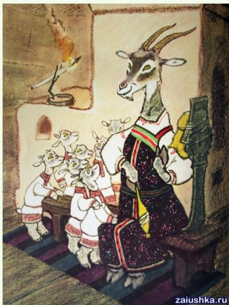
Рисунок Е. Рачёва