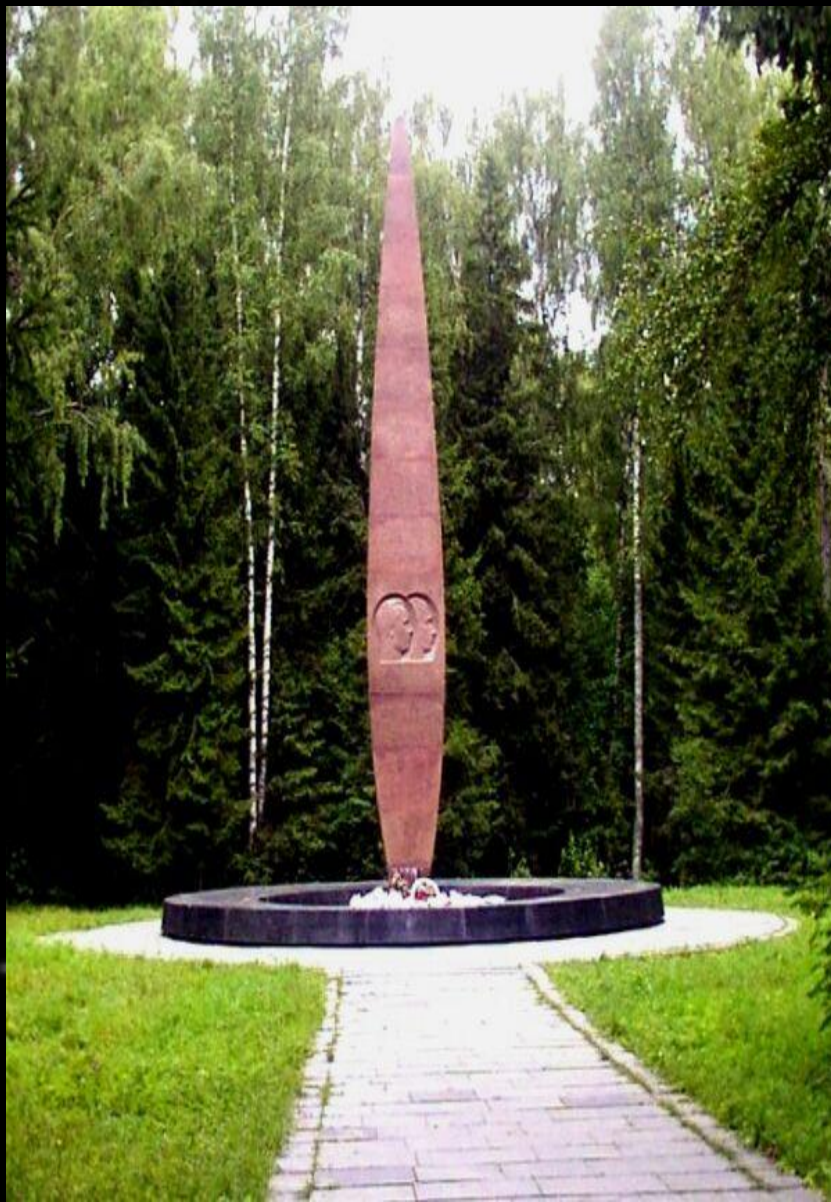
Обелиск на месте гибели лётчиков