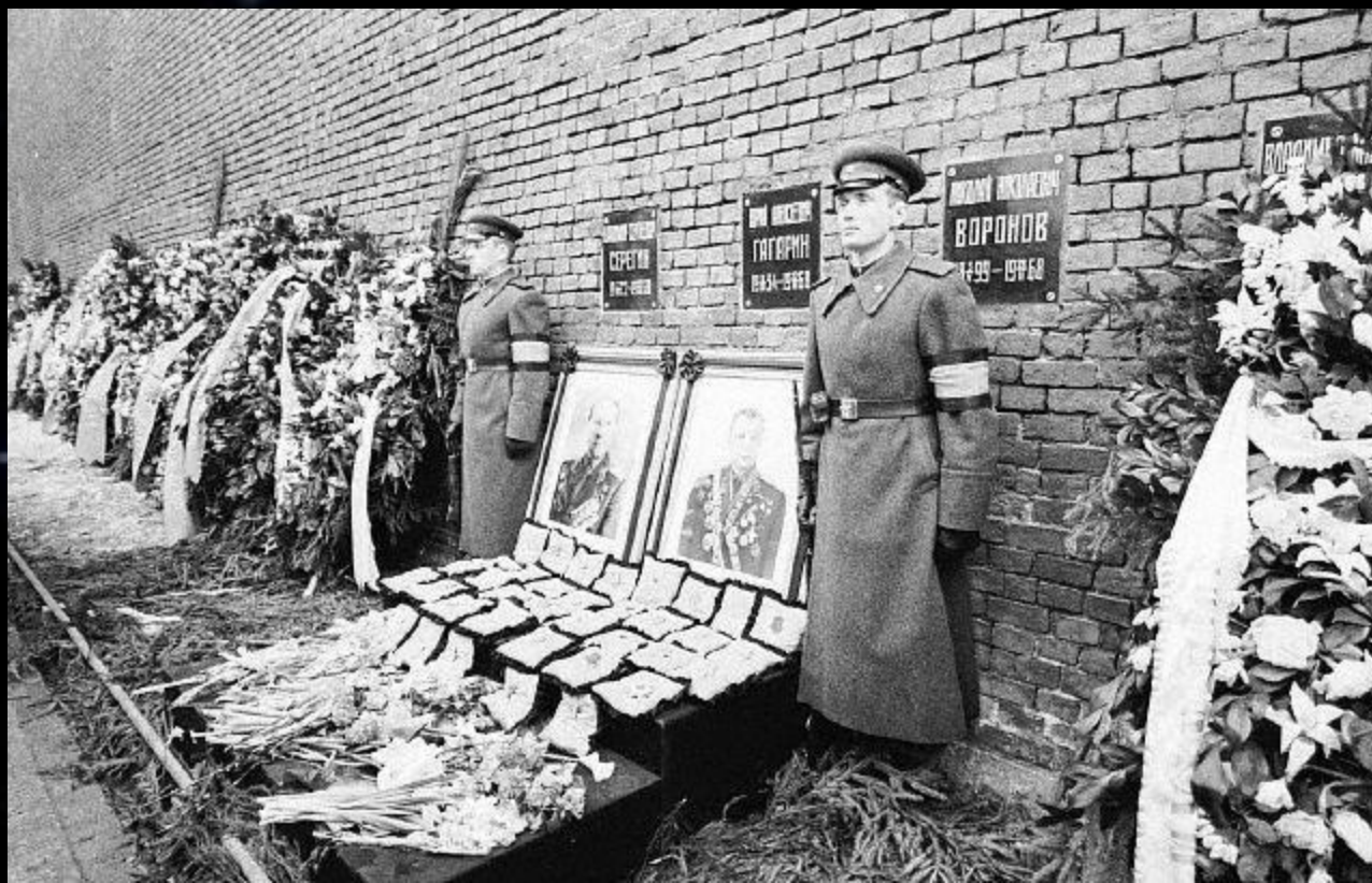
Похоронен Юрий Гагарин у Кремлёвской стены на Красной площади.