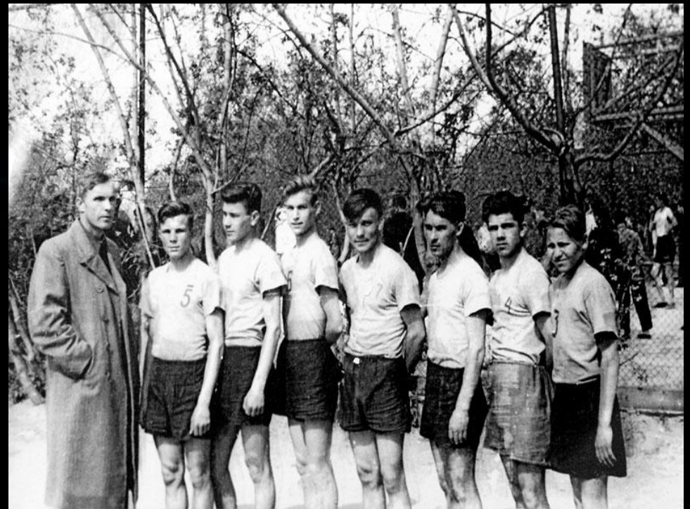
Юрий Гагарин – капитан баскетбольной команды Саратовского индустриально техникума