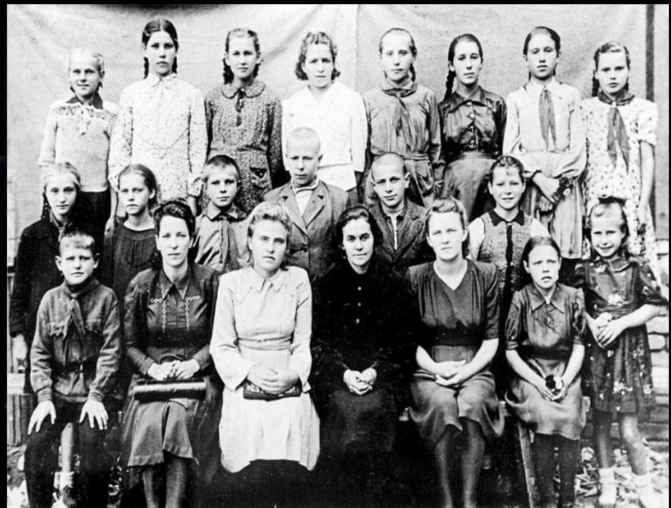
Одноклассники Юрия Гагарина