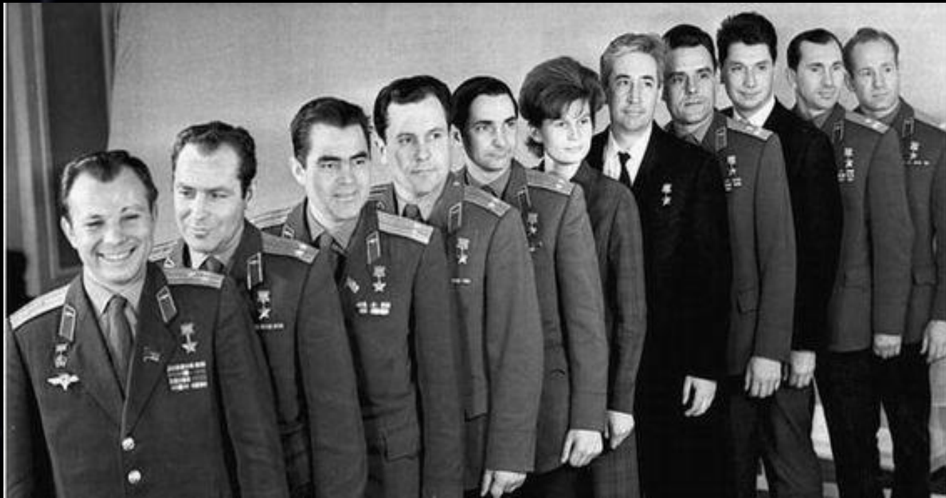
Отряд первых космонавтов

С 25 марта начались регулярные занятия по программе подготовки космонавтов.