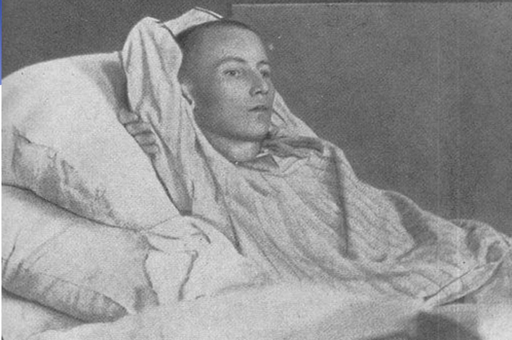
14 нче апрель, 1913 нче ел. Г.Тукайның соңгы сурәте