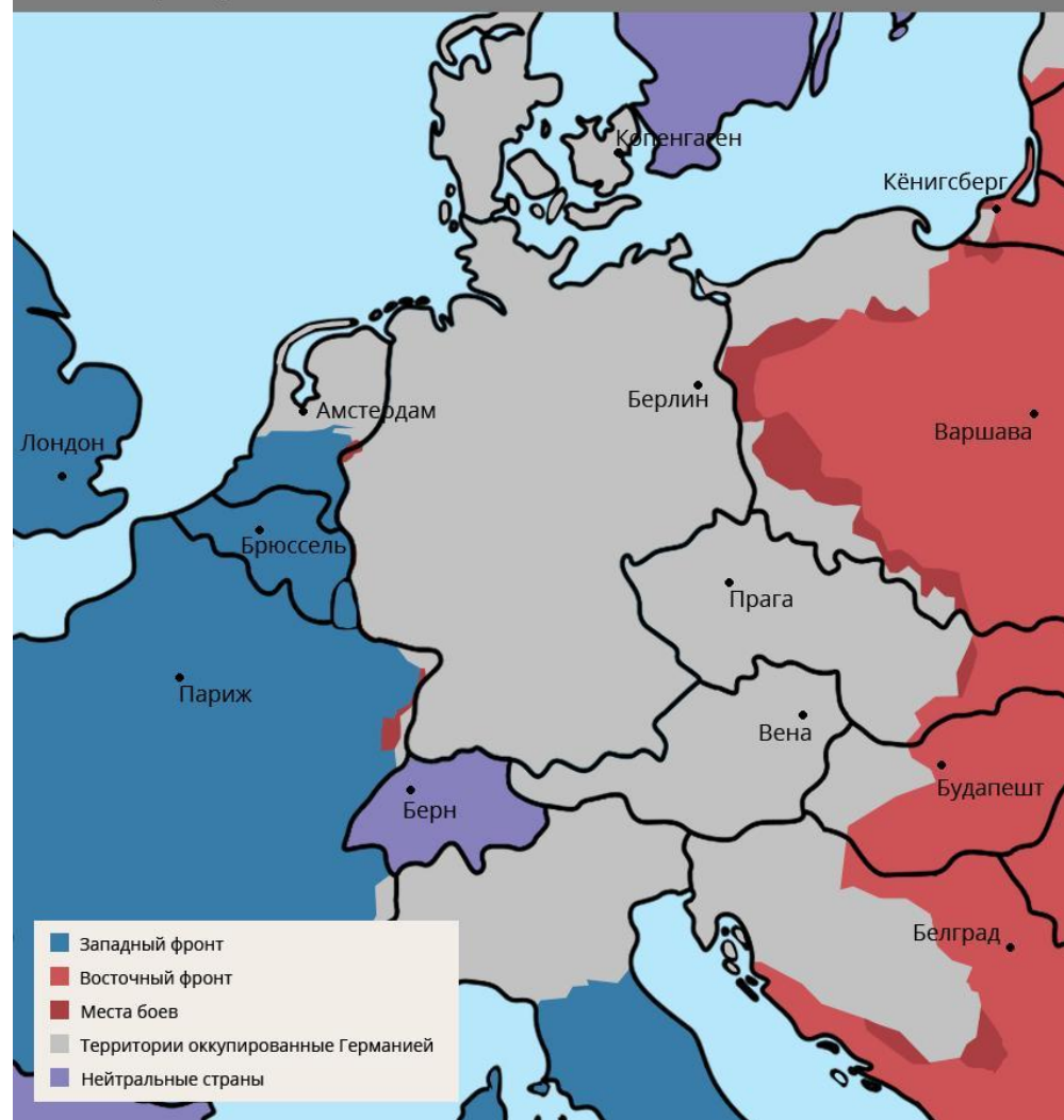
Положение на фронтах Второй Мировой войны на 15 февраля 1945 года

Лидеры признали справедливым обязать Германию возместить ущерб в натуре в максимально возможной мере. Будет создана комиссия по возмещению убытков, которой поручается также рассмотреть вопрос о размерах и способах возмещения ущерба