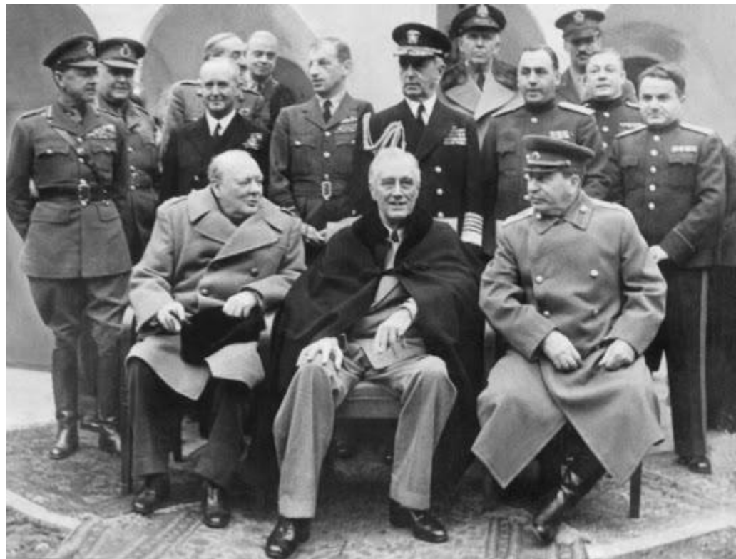
Черчилль, Рузвельт, Сталин

Крымская конференция (4-11 февраля 1945 г.) проходила с участием глав правительств трех союзных держав И. Сталина, Ф.Рузвельта и У. Черчилля в Ливадийском дворце. На конференции обсуждались коренные вопросы, касавшиеся завершения Второй мировой войны, в т.ч., об условиях капитуляции Германии, о зонах ее оккупации, репарациях, статусе Польши и её границах. Положительно был решен вопрос о создании международной организации безопасности.