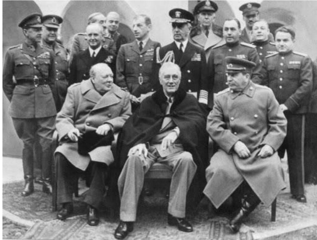
Черчилль, Рузвельт, Сталин

Крымская конференция (4-11 февраля 1945 г.) проходила с участием глав правительств трех союзных держав И. Сталина, Ф.Рузвельта и У. Черчилля в Ливадийском дворце. На конференции обсуждались коренные вопросы, касавшиеся завершения Второй мировой войны, в т.ч., об условиях капитуляции Германии, о зонах ее оккупации, репарациях, статусе Польши и её границах. Положительно был решен вопрос о создании международной организации безопасности.