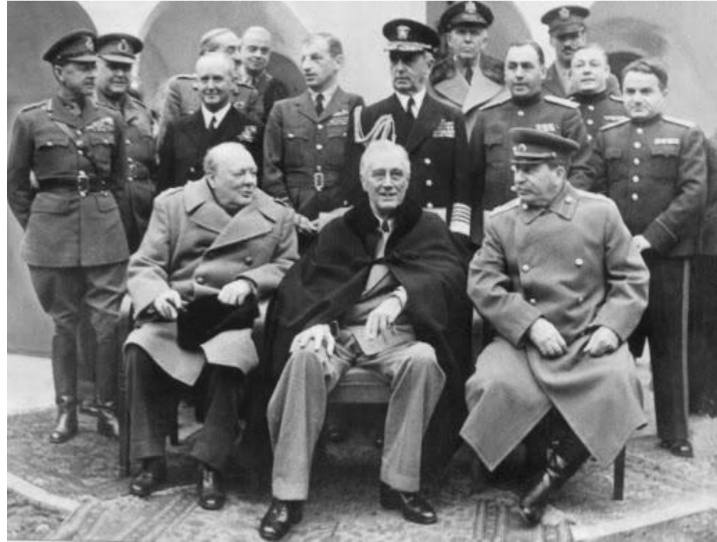
Черчилль, Рузвельт, Сталин

Крымская конференция (4-11 февраля 1945 г.) проходила с участием глав правительств трех союзных держав И. Сталина, Ф.Рузвельта и У. Черчилля в Ливадийском дворце. На конференции обсуждались коренные вопросы, касавшиеся завершения Второй мировой войны, в т.ч., об условиях капитуляции Германии, о зонах ее оккупации, репарациях, статусе Польши и её границах. Положительно был решен вопрос о создании международной организации безопасности.