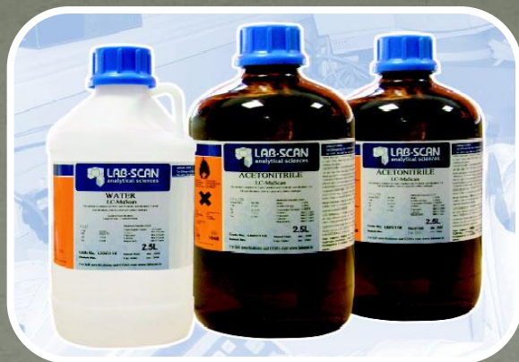
Ангидрид уксусной кислоты