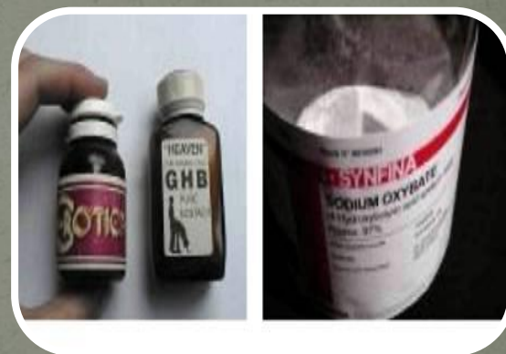
Натрий оксибутират (GHB)