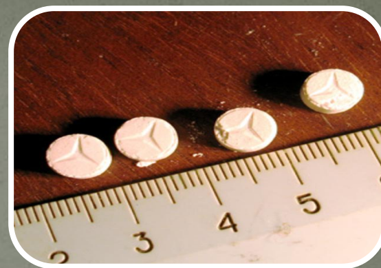
Натрий оксибутират (GHB)