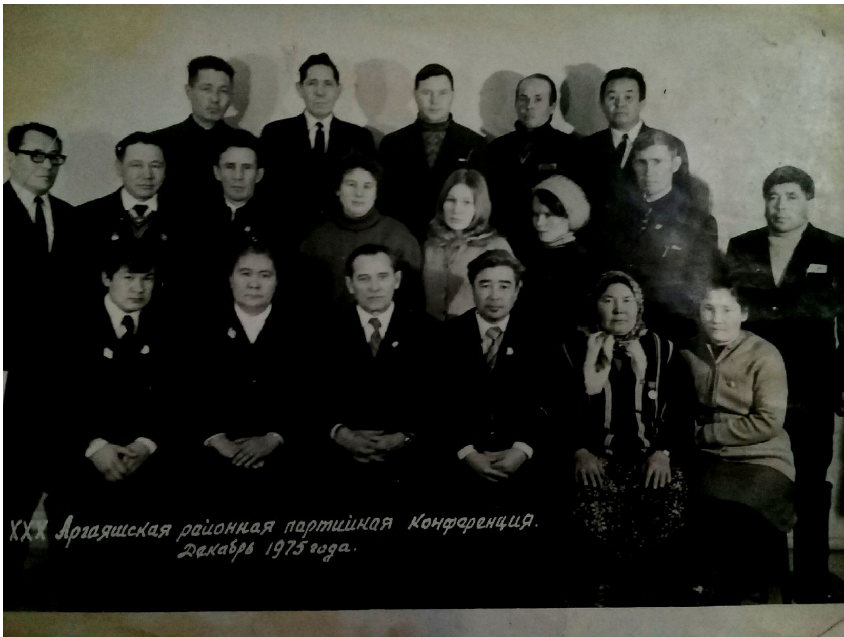
XXX Аргаяшская районная партийная конференция. Декабрь 1975 года.